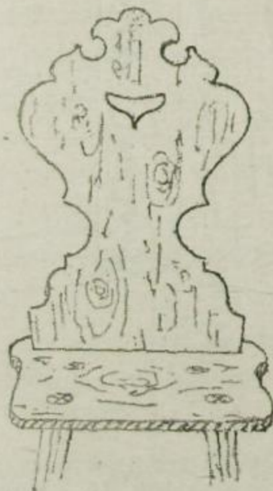
Fig. 14. Hemmehübel.

ihr, bei aller Beschränktheit der konstruktiven und ästhetischen Mittel, eine gewisse Schönheit erkennen will, wäre es auch nur die des unbedingten Sichdeckens von Zweck und Form. Wo es sich mit der Be-