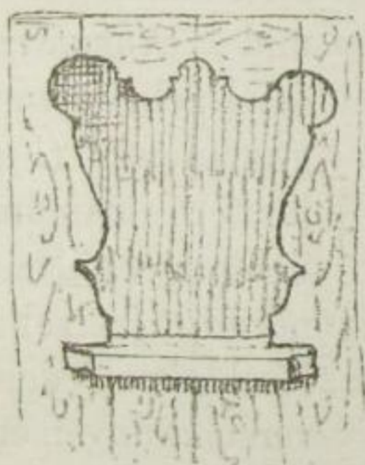
Fig. 12. Dittersbach.

auch aus diesem Gesichtspunkte erklären. Ebenso wird, im Gegensatze zum sächsischen Fachwerkbau, ängstlich darauf geachtet, dass die Hirnholzflächen nirgends den Witterungsangriffen preisgegeben werden; zu dem Zwecke werden die Säulen aussen vor die durchreichenden Köpfe der Querwand-Hölzer gestellt (Fig. 5 und 41), wird vor die Köpfe der Deckenbalken ein kräftiges Schutzholz gelegt, die Giebelverschalung über die Schwellenköpfe herabgezogen (Fig. 10), ja selbst die obere Fläche der Decklatten durch wagerechte Deckplättchen geschützt (Fig. 11). Ueberhaupt ist die Zweckdienlichkeit in dieser aus dem Bedürfniss hervorgegangenen Bauweise das oberste Prinzip, und diesen Umstand muss man beständig im Auge behalten, wenn man in