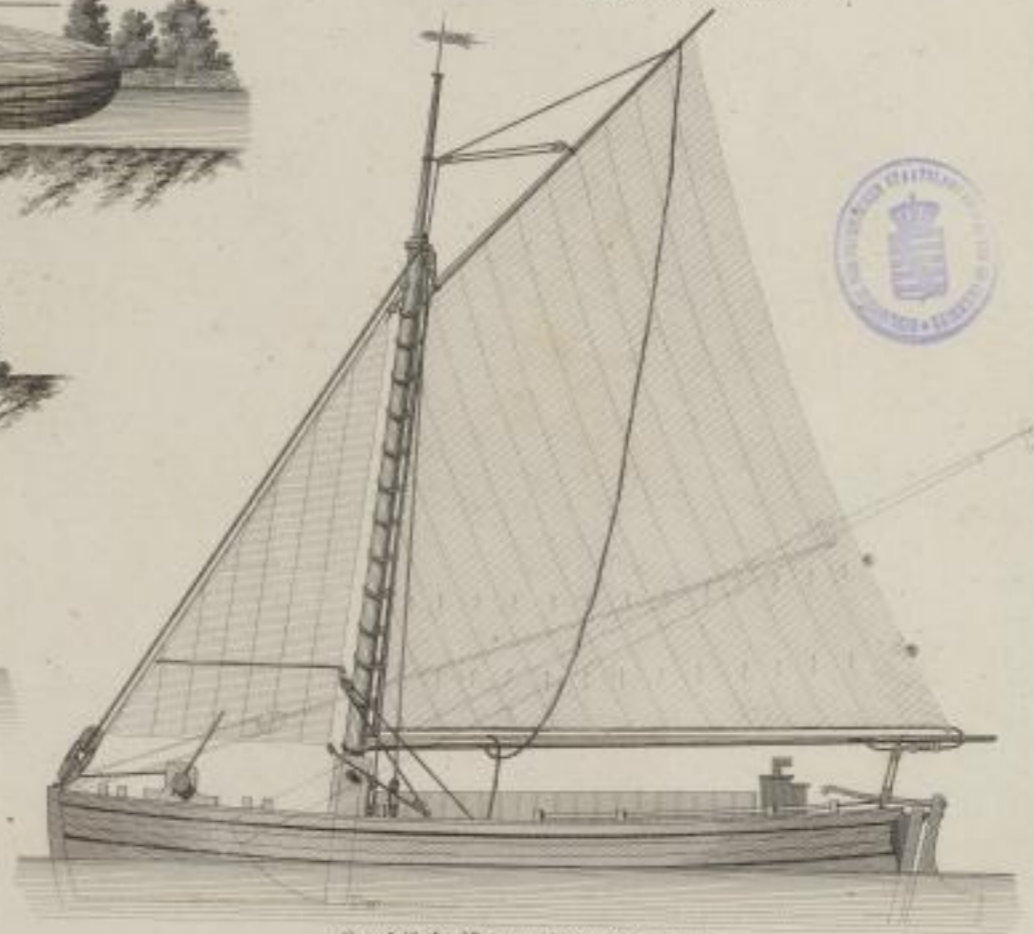
Fig. 3. Längensicht.