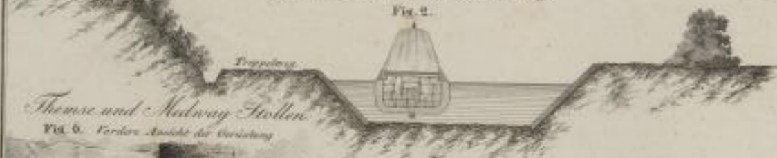
Thames und Midway Stollen.