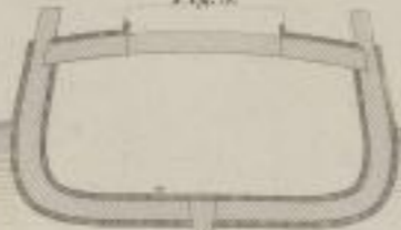
Bei Fig. 6 ist \frac{1}{2} Zoll = 1 Fuß. Bei Fig. 7 bis 9 ist \frac{1}{4} Zoll = 1 Fuß.