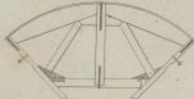
Fig. 7. Mittelteil der Vorrichtung.