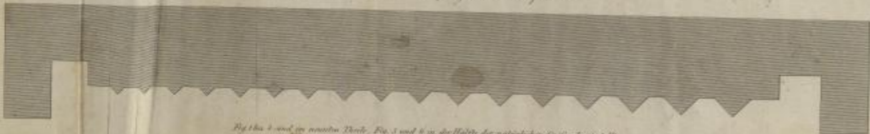
Schne zum Abstreifen des zweyten Walzenpaares.

Fig. 1 bis 4 sind im natürlichen Dache, Fig. 5 und 6 in der Hälfte der natürlichen Größe dargestellt.