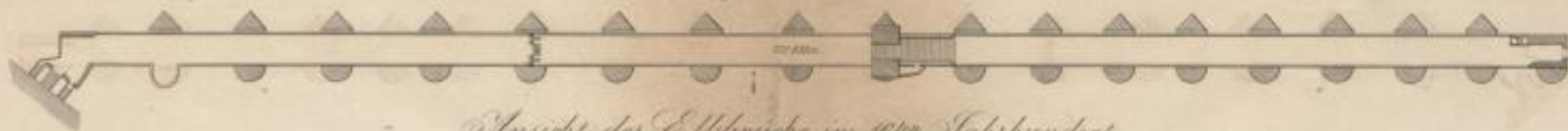
Ansicht der Elbrücke im 16 ten Jahrhundert