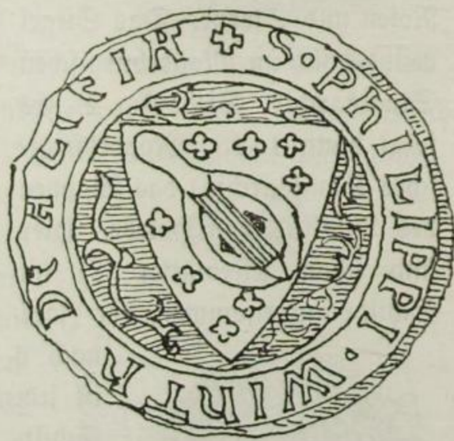
Fig. 1. Herren von Alzey.

welche wir „wappenmäßig“ nennen, der Gebrauch des Helmschmuckes ist später entstanden, dem Helmschmuck auch nie die Bedeutung wie dem Schilde beigelegt worden.