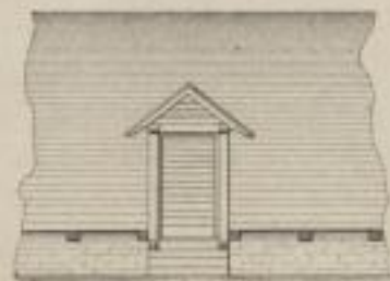
Ansiicht des Dachboden-Einganges.