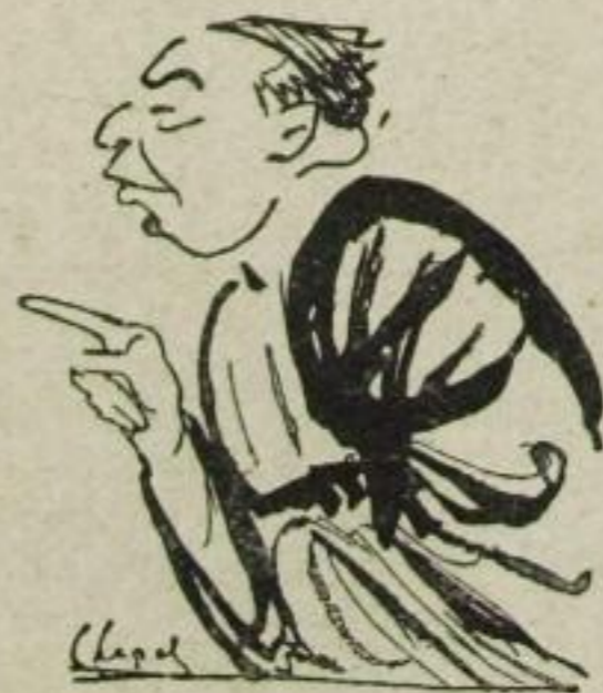
Der Herr Präsident