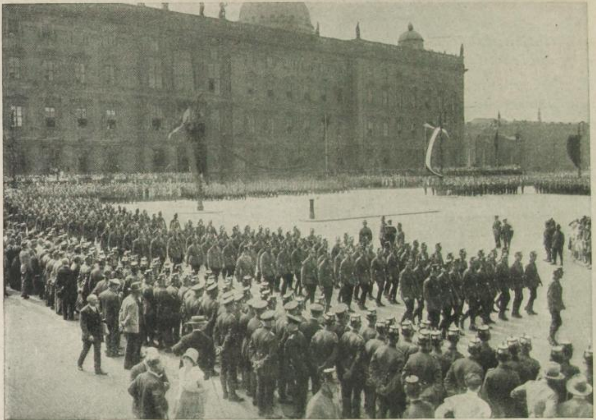
Die Berliner Schutzpolizei feierte am 12. August den 10jährigen Verfassungstag. Unser Bild zeigt den Aufmarsch am Lustgarten