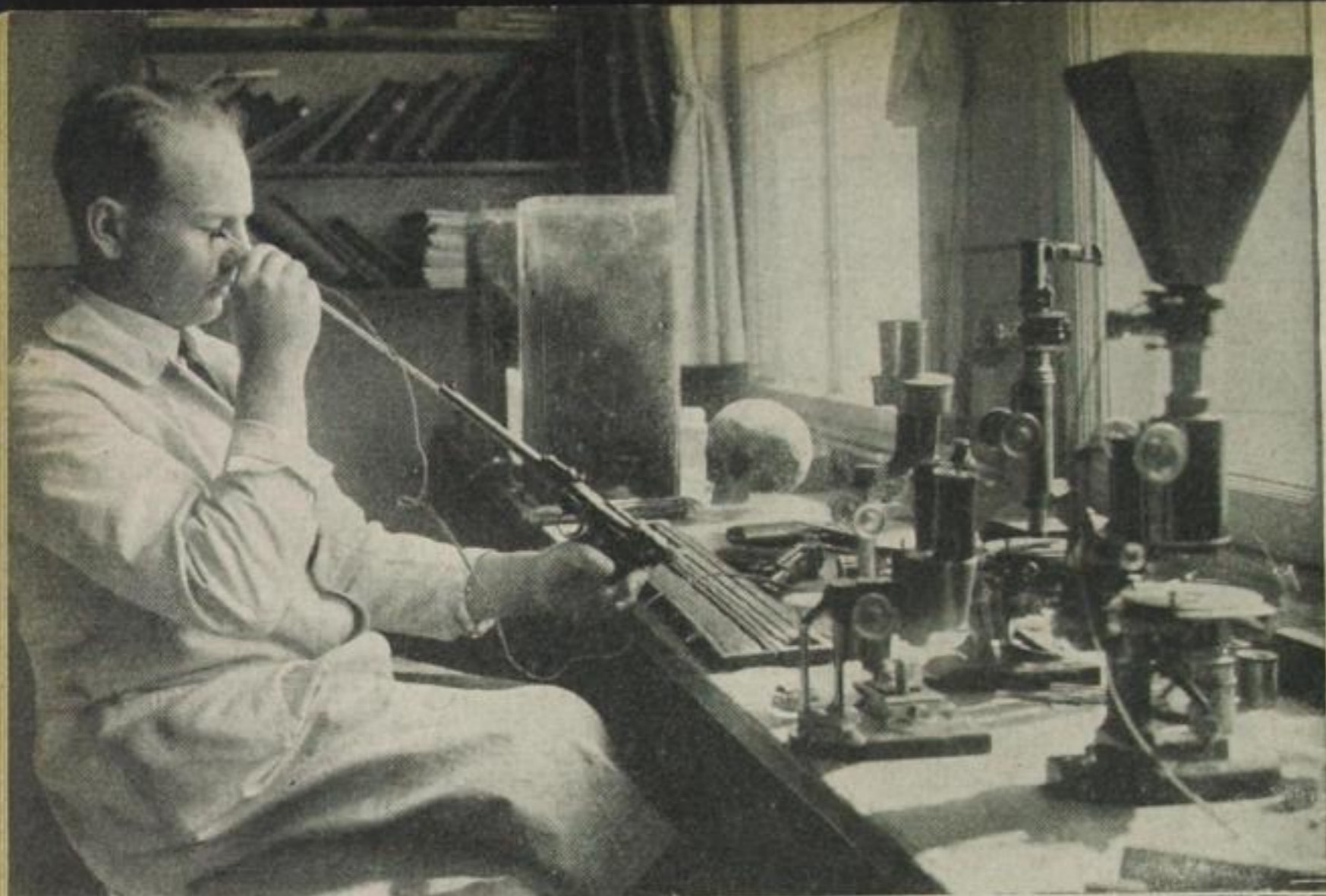
Gewehr- und Schädelunter- suchung im Dienste der Kriminalistik. Diese Unter- suchungen spielen bei Mord- fällen eine entscheidende Rolle