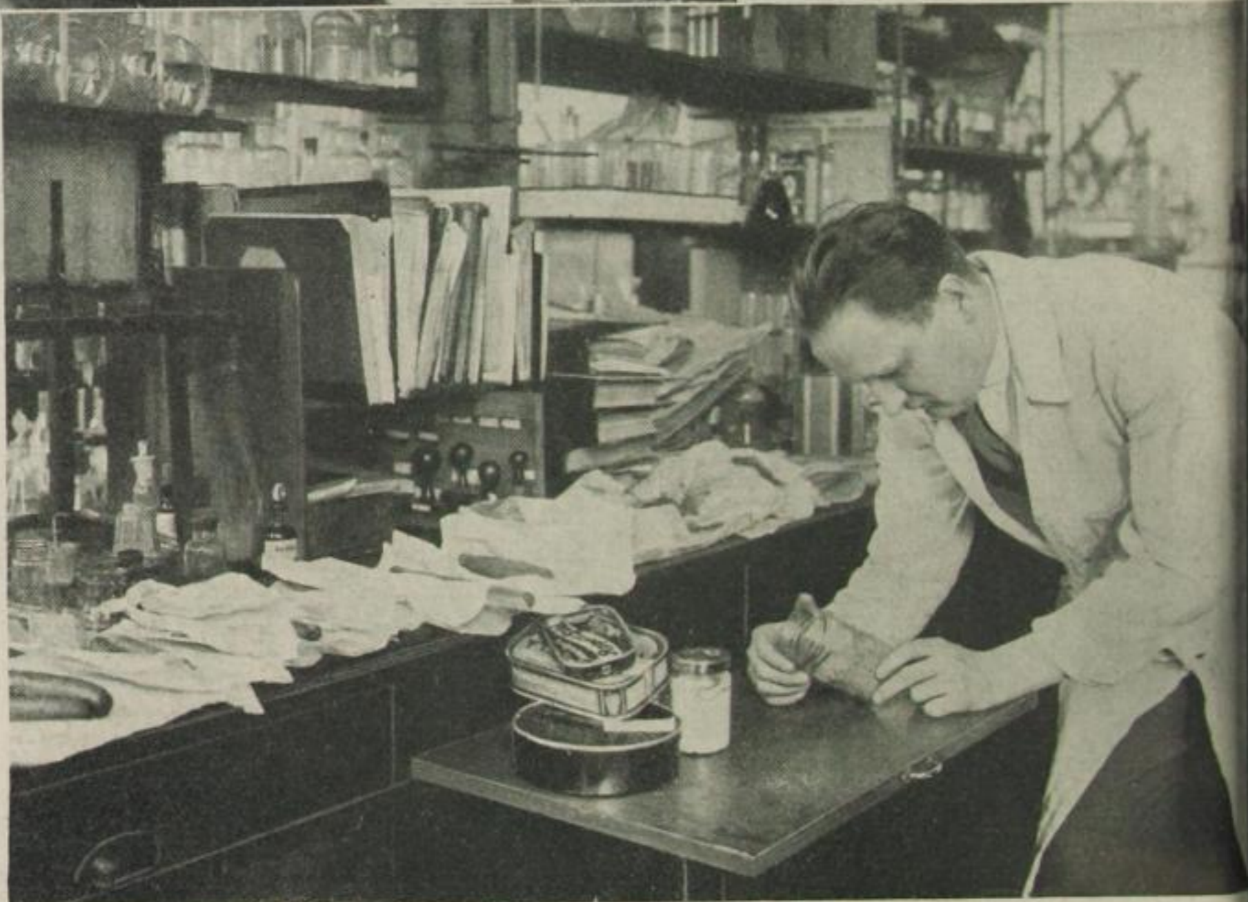
Die Lebens- mittelfäl- schungen ge- fährden die Gesundheit des Groß- städters. Wurst-, Sar- dinen- und Konserven- untersuchung