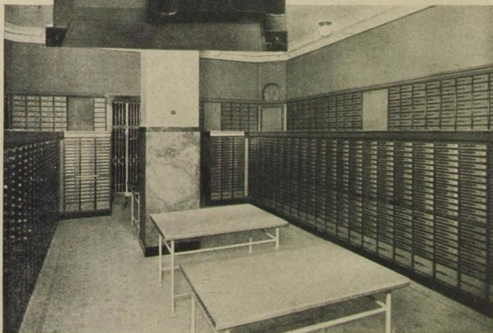
Unten: Neuzeitlicher Kundentresor in der Stahlkammer