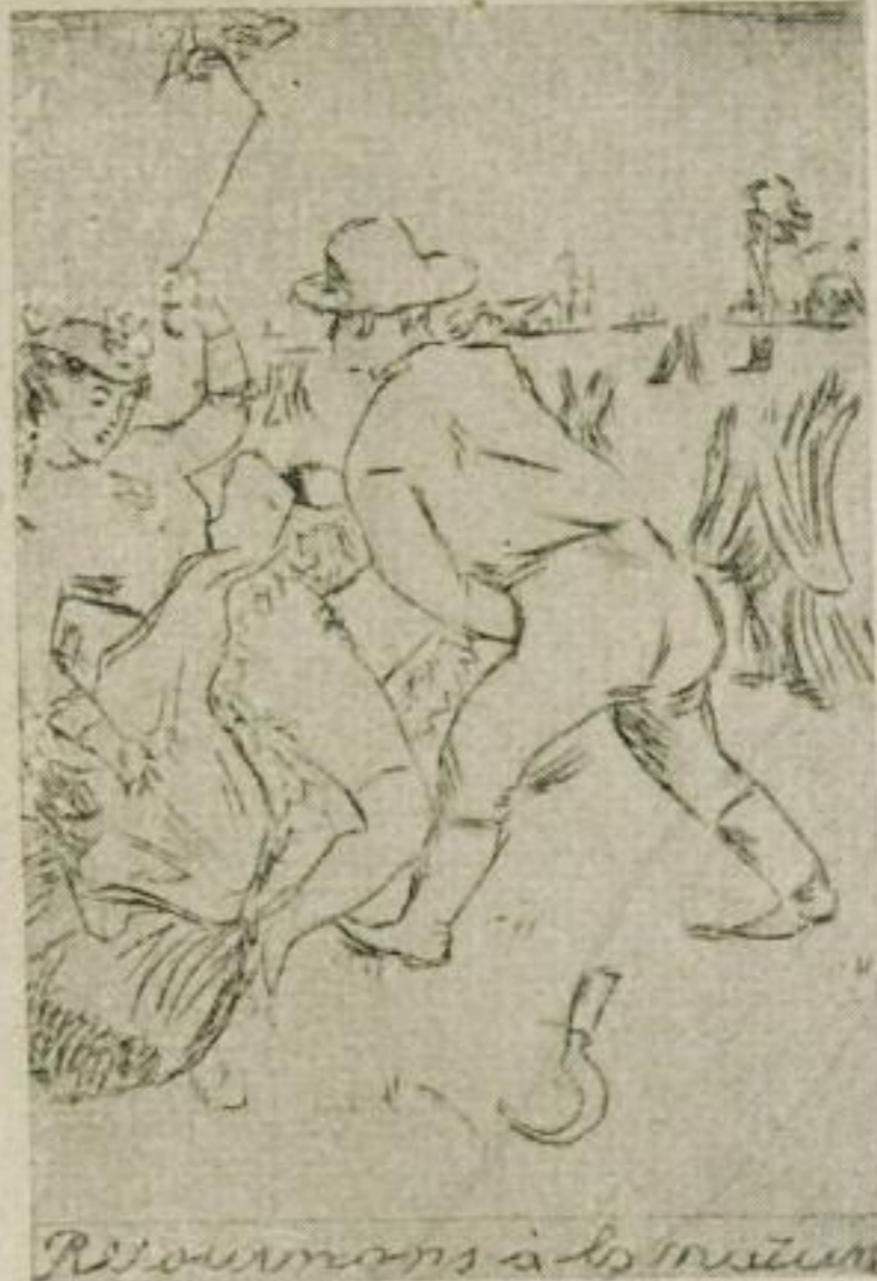
Roumans à la mesure

Die beschlagnahmten und zur Vernichtung verurteilten Photographien werden verbrannt, bis auf ein einziges Exemplar, das in einem der nach Materien geordneten Sammelalben fein säuberlich eingeklebt wird. Bei jeder neuerlichen Beschlagnahme erfolgt Prüfung, ob wegen der gleichen Aufnahme früher Verurteilung erfolgt ist. Auf diese Weise gelingt es nicht selten, dem bereits einmal abgeurteilten Fabrikanten wiederholte Zuwiderhandlung nachzuweisen. Welche Dimensionen der Handel mit solchen obszönen Photos angenom-