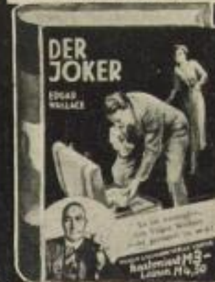
EDGAR WALLACE: Der Joker

Der deutsche Meister des Detektivromans nimmt hier den internationalen Mädchenhandel zum Thema für ein Werk von unerhörter Spannung. Und alles wird mit einem weltmännischen Humor erzählt, der entzückt.