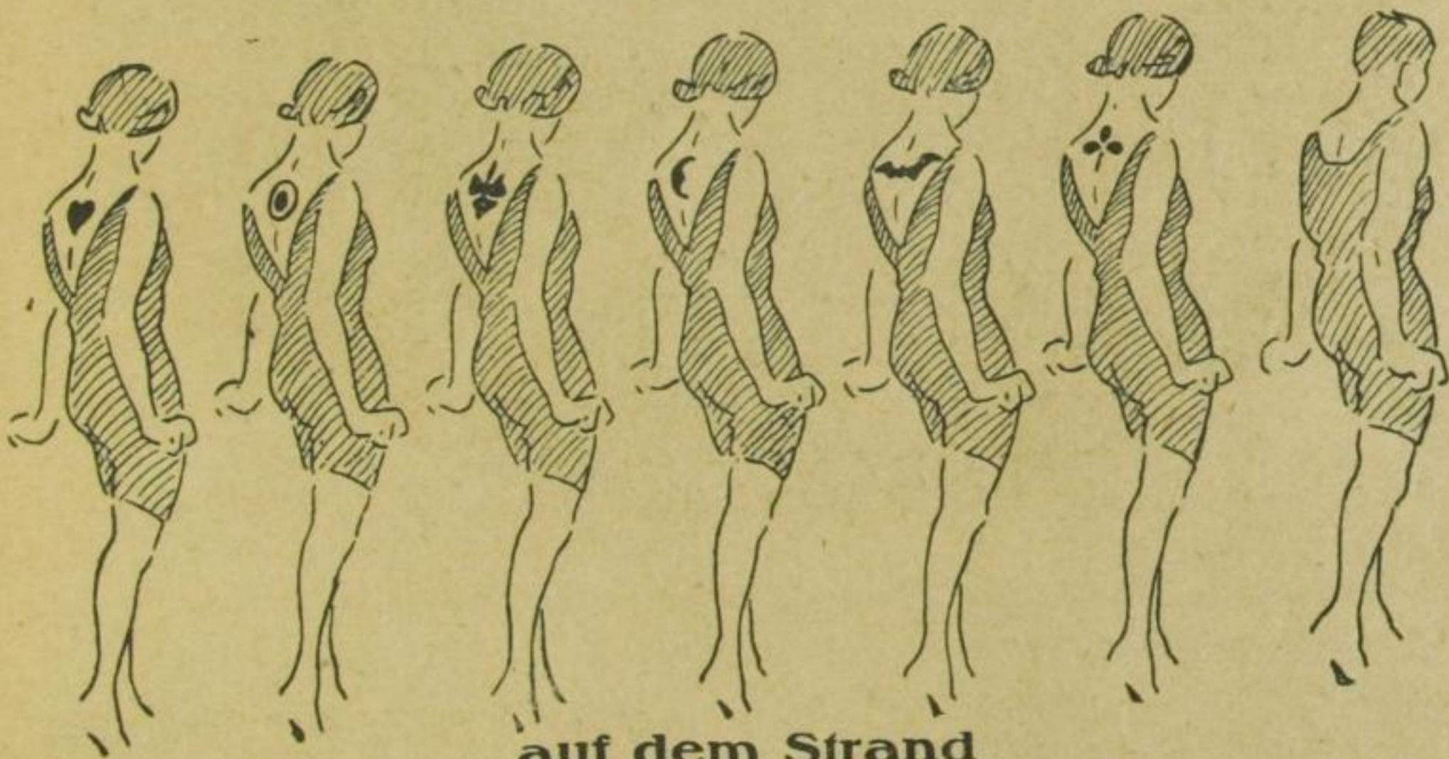
auf dem Strand