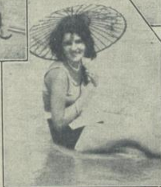
Am schönen Strande von Riccione