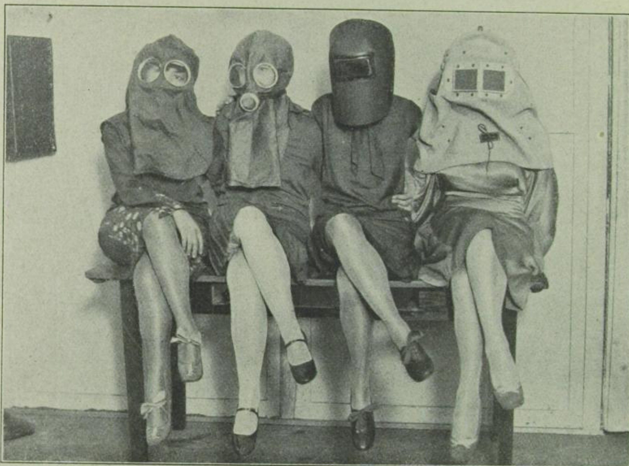
Neue Masken zur Verschönerung des Gesichts