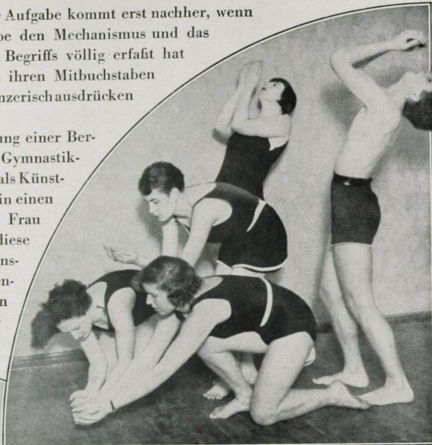
Sobald sich der Buchstabe bereits eingepägt hat, beginnt man, ohne die Tasten zu üben. Fünf begabte Buchstaben, die den DURST darstellen