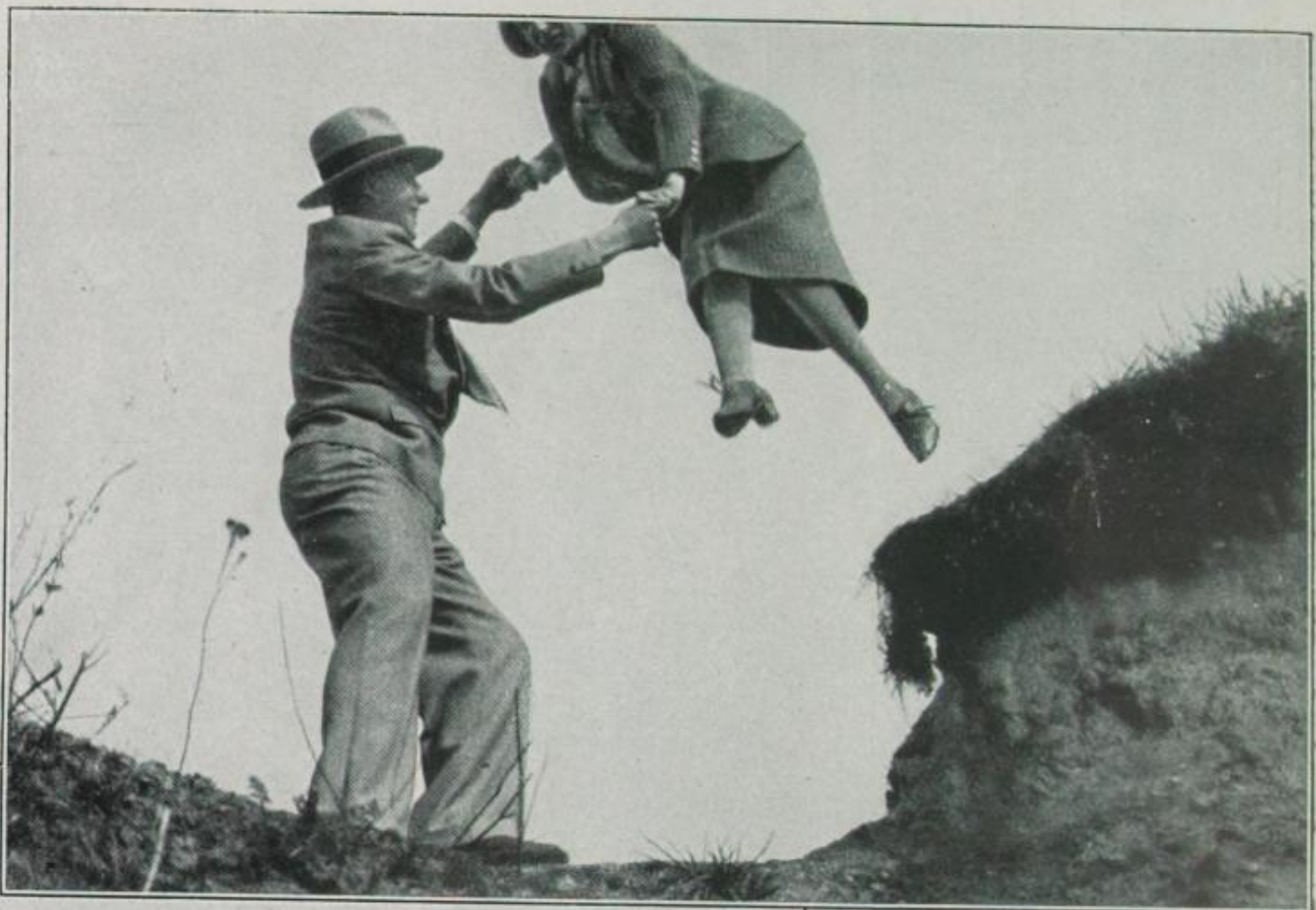
Der Sprung ins Ungewisse Eine sehr symbolische Uebung