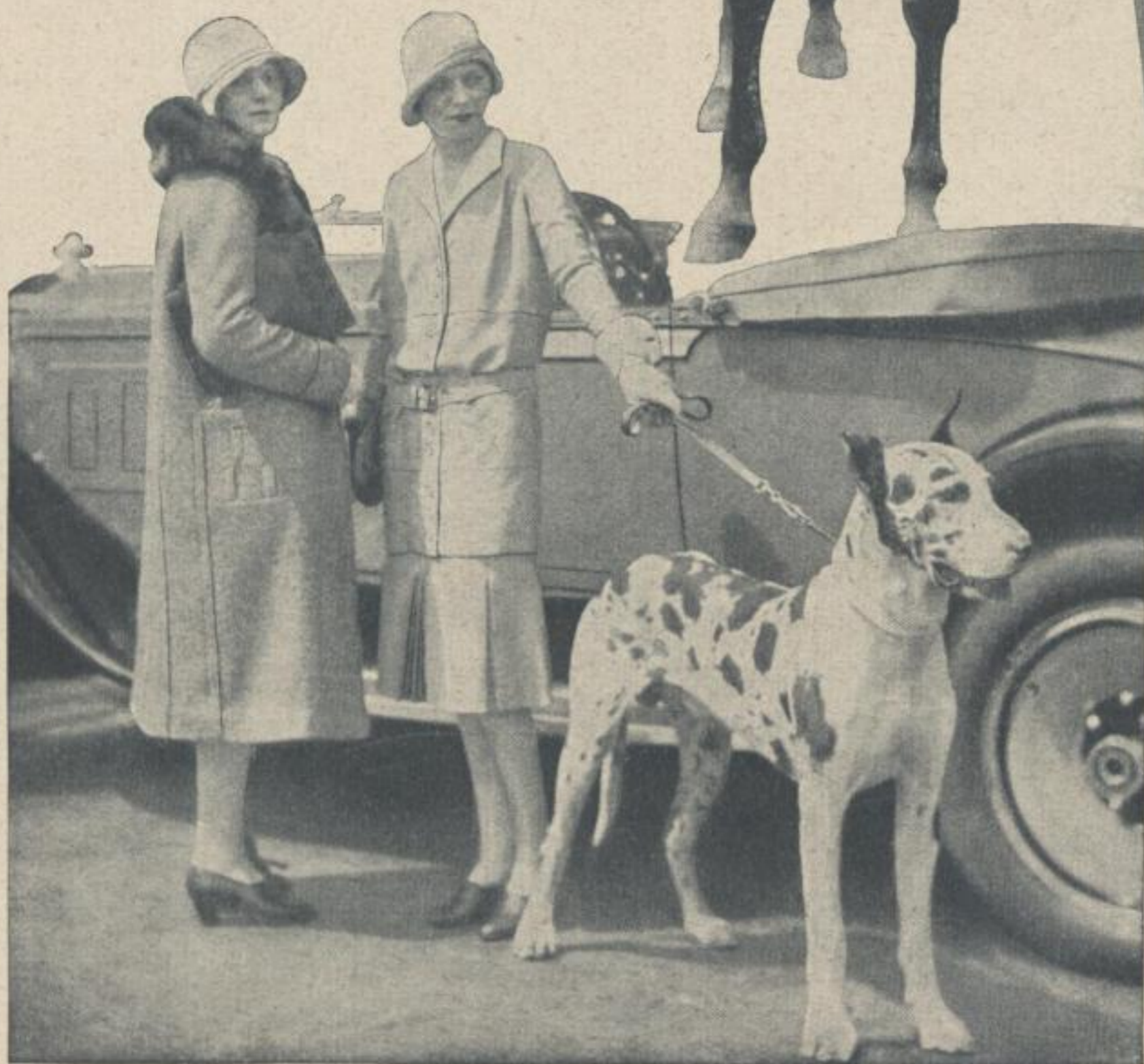
Schicke Autosport- Kleidung Modelle: Jean Pa'ou Paris