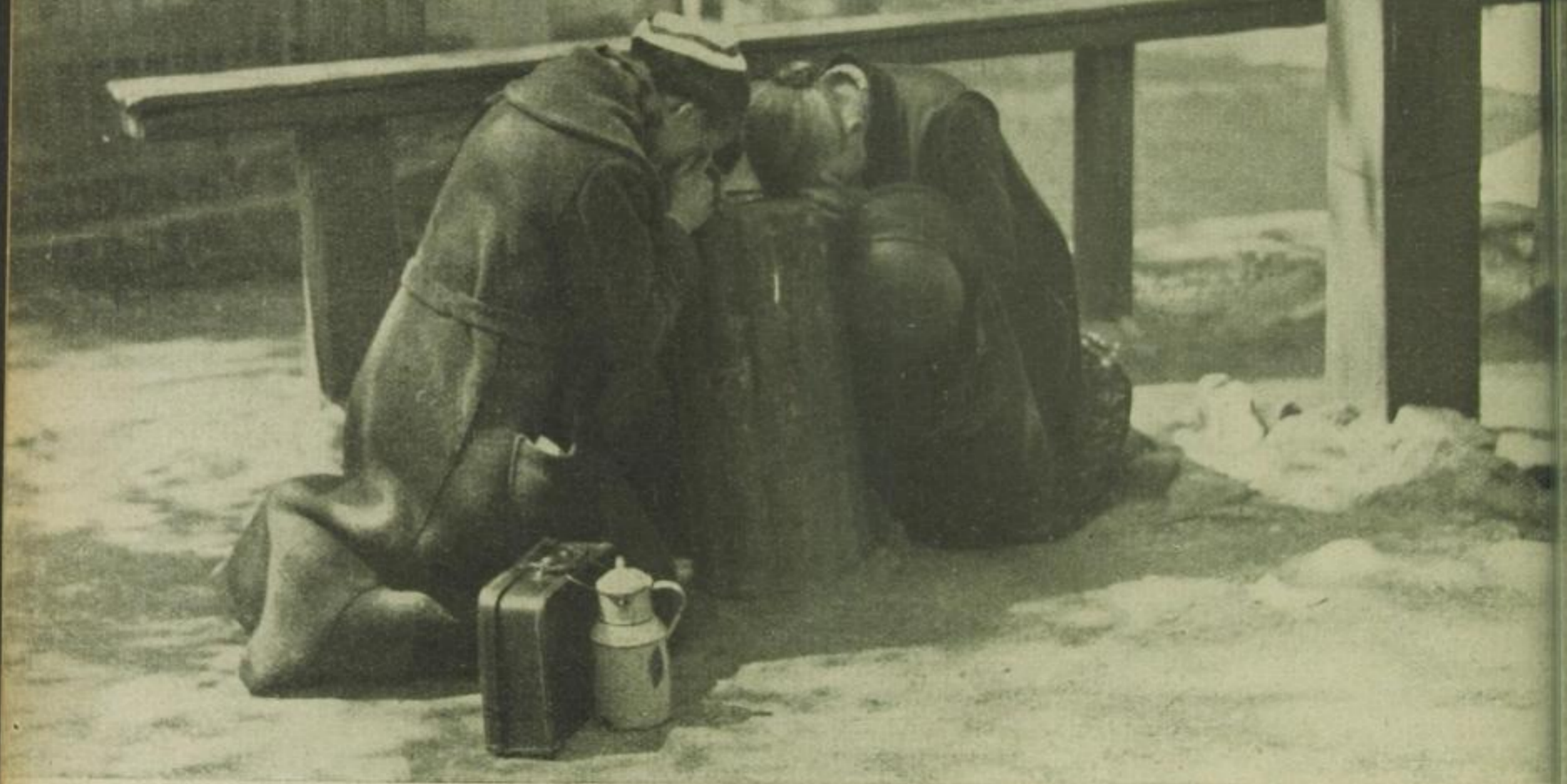
Betende Frauen an einem Stein bei Golgatha, der die Stelle kennzeichnet, an der ursprünglich das Kreuz des Herrn stand.