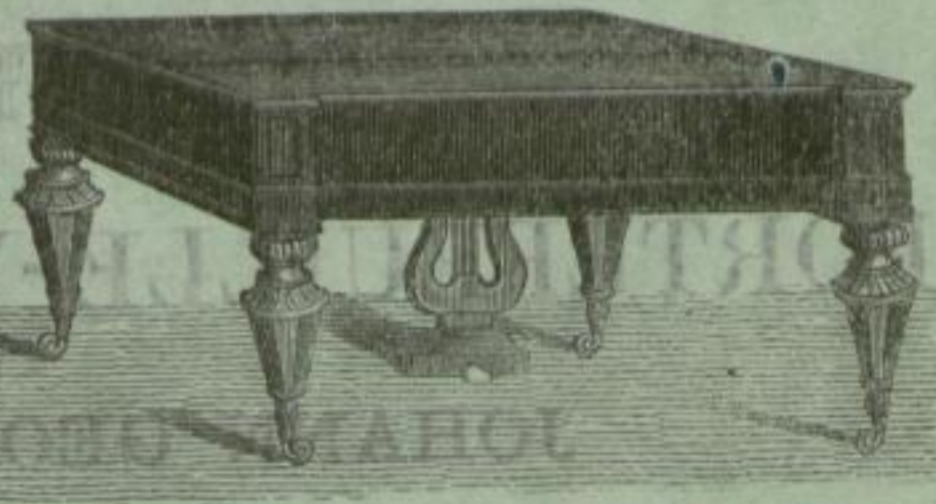
Tafel-Pianoforte, grosses format.

Schräg und grad besaitet, Anhängeplatte mit und ohne belegten Stimmstock von Eisen in mehreren Formen.