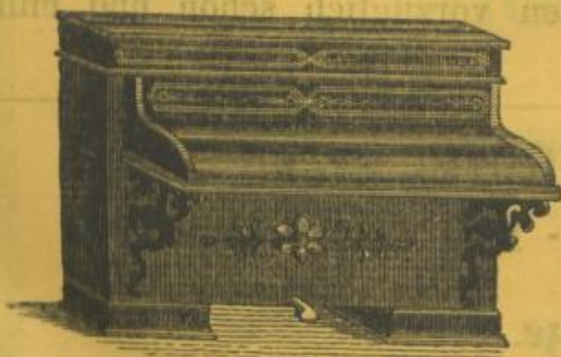
Pianino. 7 Octav. 3saitig.

Mechanismus nach Erard, Anhängeplatte nebst Metall belegtem Stimmstock und Capotaster. 4 Ober- und 4 Unter-Spreitzen.