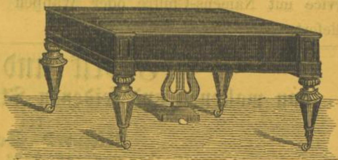
Tafel-Pianoforte, grosses format. Hinterstimmig 7 Octav.

Schräg und grad besaitet. Anhänge- platte mit und ohne belegtem Stimm- stock von Eisen in mehreren Formen.