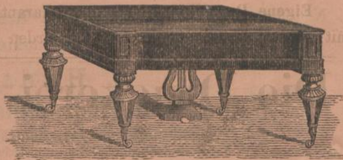
Tafel-Pianoforte, großes Format.