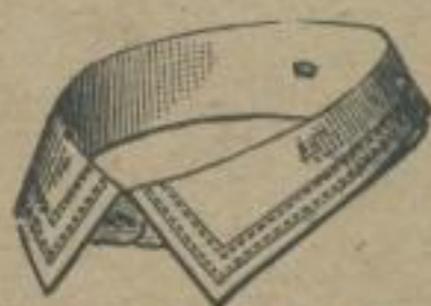
GLORIA B Kinderkragen. Weiten: 28—34 Cm. Das Dutzend 45 Pf. 12 Dutzend 4 M. 80 Pf.