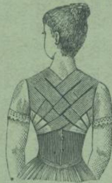
von Special-Aerzten empfohlen. (besprochen No. 23 der Gartenlaube, Jahrg. 1886, u. No. 255 der prakt. Wochensch. "Fürs Haus" Jahrg. 1887 etc.) Prospecte und Anleitung zum Maassnehmen gratis und franco.

praktischstes neuestes System, ohne Stahl oder sonst einen harten Gegenstand