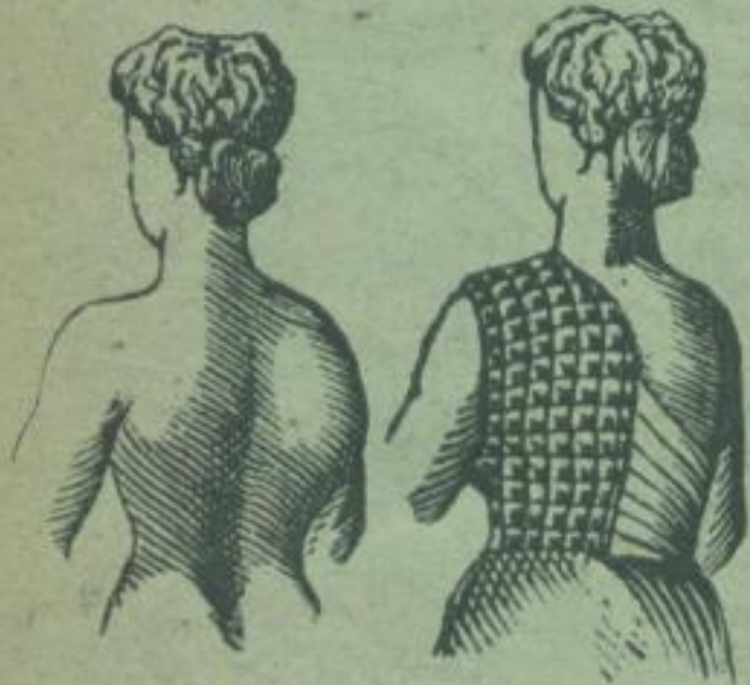
Neuestes System, von ärztl. Autoritäten empfohlen.

Kunstvolle Maskirungen hoher Schultern und Hüften ohne Polsterung und ohne Stahlstäbe.