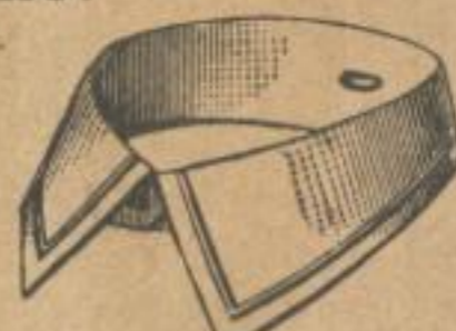
GREECE B. Schnurnäht. Umschlag 5 3 / 4 cm. breit. Weiten: 31—50 cm. Dtzd. M. —.75. Gross „ 8.75.