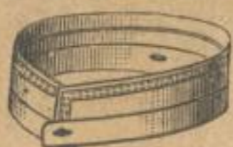
CHARLES Einfacher oder Doppelsteppstich. Weiten: 31—50 cm. Dtzd. M. —.60. Gross „ 7.—.