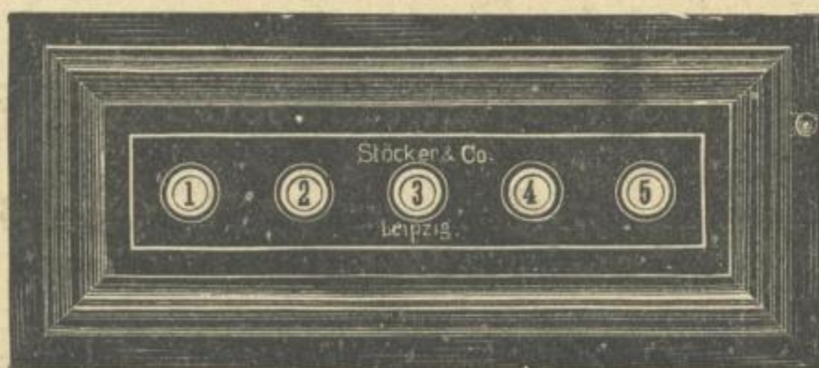
No. 4940/5. Tableau

Kosten-Anschläge und nähere Auskünfte gratis.