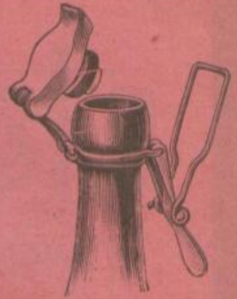
Neuester praktischer Wasserverschluss.