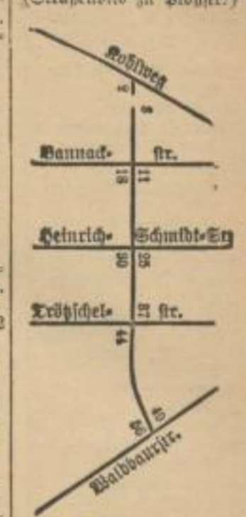
(Straßenbild zu Bloßstr.)