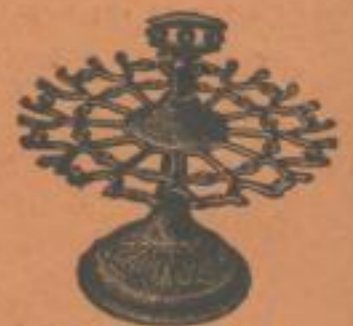
Stempelständer in Guß und vernickelt