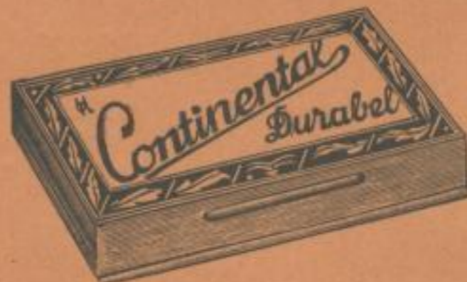
Stempelkissen seit Jahren bewährt