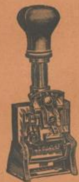
Paginier- u. Nummerier-Maschinen