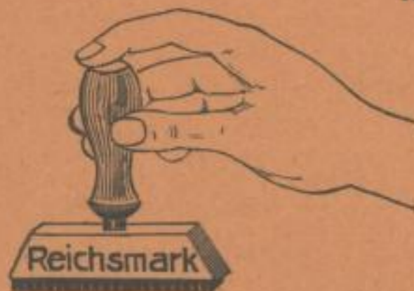
Kautschukstempel in bester Qualität

liefert seit 20 Jahren in nur bester Qualität