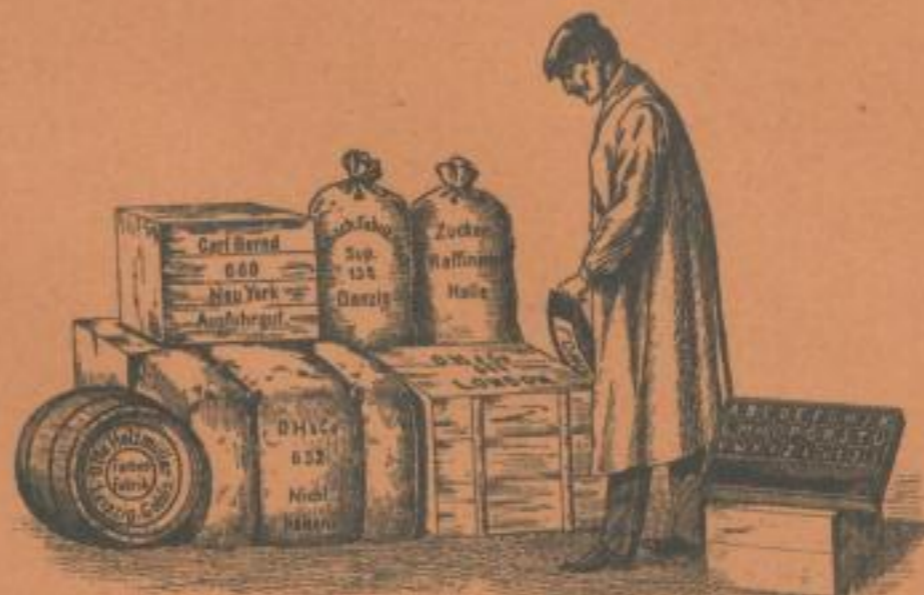
Signier-Stempel für Kisten, Säcke usw.