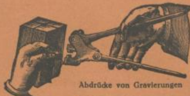
Abdrücke von Gravierungen Plombenzangen für Post- u. Bahnsendungen, Pakete, Rauchwaren usw.