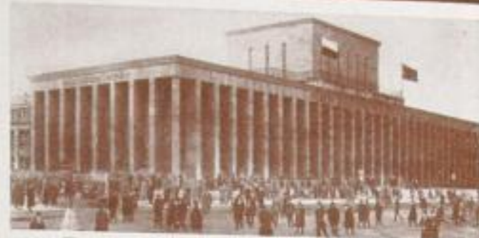
Technische Messe, Halle 9, Außenansicht