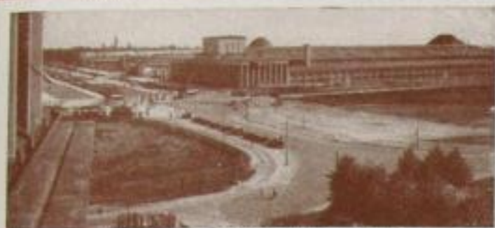
Blick auf das Ausstellungsgelände von der Straße des 18. Oktober