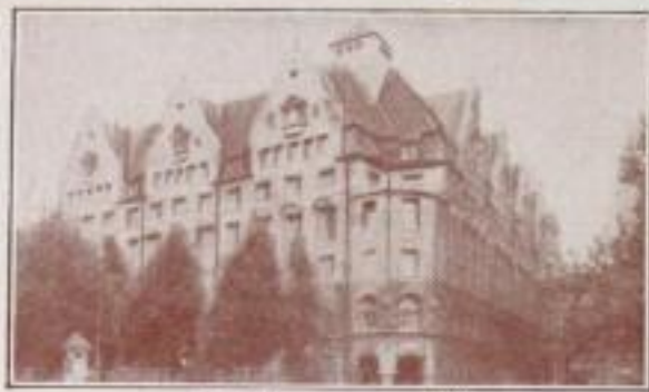
Stadthaus von SW