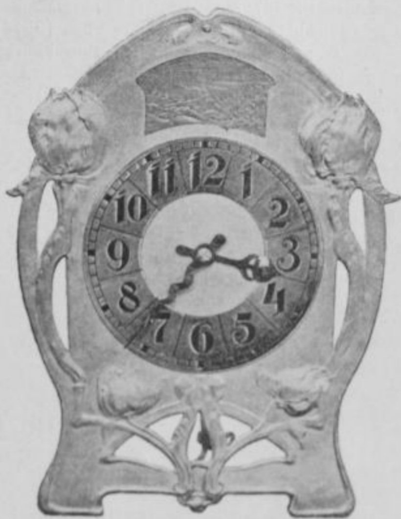
Moderne Zimmeruhren von J. Jagemann, München. Muster gesetzl. geschützt.