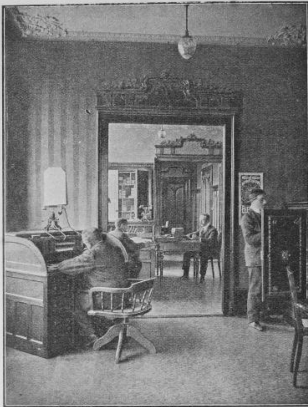
Die kaufmännischen Bureaux.

Fabrikation der Rohwerke (Ebauches); im ersten Stock: die kaufmännischen Bureaux (Verwaltung, Verkauf, Buchhaltung, Versand) sowie das Atelier für die Steinfassung; im zweiten Stock: die Fabrikationsbureaux, die Visiteure und die Regleure und die geräumigen Ateliers für das Zusammensetzen der Uhr (Remontage); im dritten Stock: der Hausmeister und Nebenräume. Im Hintergrund des Hofes enthält ein Schuppen: eine Camera obscura zur Photographie und Vervielfältigung der technischen Zeichnungen und Pläne, die Messing-, Stahl-, Öl- und Benzinvorräte, sowie eine Remise für das Automobil, das die Firma ihren Kunden zur Verfügung stellt. Eine der schwierigsten Aufgaben war die Einrichtung der Transmissionen; man wollte ein möglichst geräuschloses Räder-