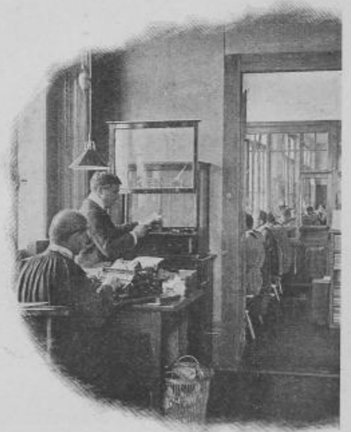
Ein Bureau der Angestellten.

Der Zweck dieses Ateliers ist hauptsächlich, Maschinen zu bauen, welche den Kalibern der Fabrik besonders angepaßt sind, und die man nicht im Maschinenhandel kaufen kann.