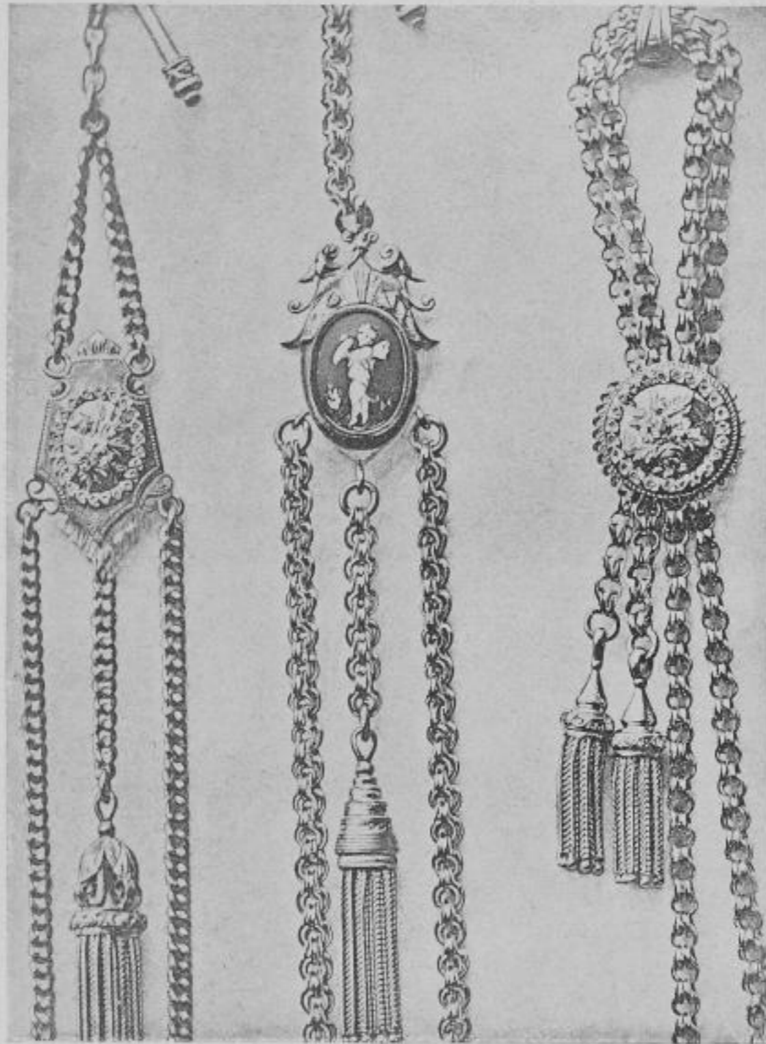
Von der Firma Louis Fiebler & Co., Pforzheim