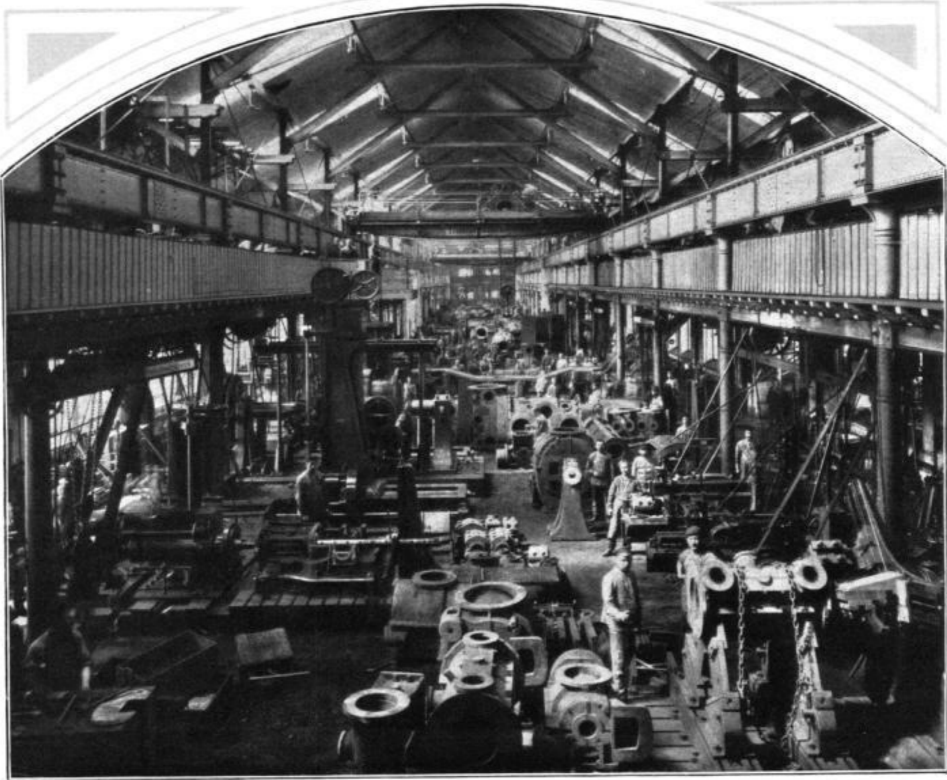
BLICK IN DIE ABT. DAMPFMASCHINENBAU

Kapital von 30000 Talern bewilligte, das nach 10 Jahren zurückzuzahlen war und 5 Jahre ohne Zinsen benutzt werden konnte. Gewiß eine große Vergünstigung, deren Hartmann auch stets dankbar gedachte, ja, er bekannte später mehr als einmal öffentlich, daß er durch diese Huld in den Stand gesetzt worden sei,