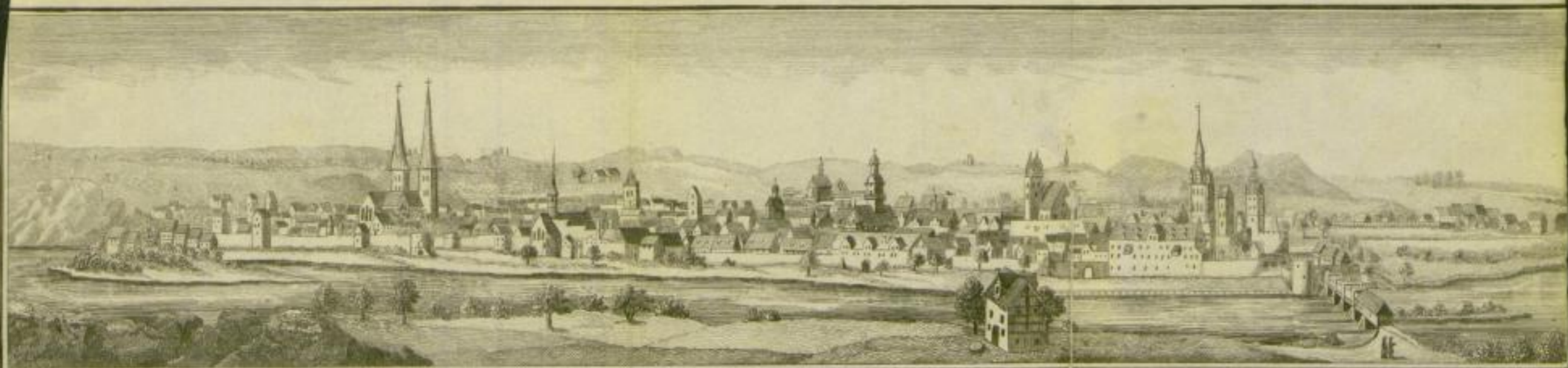
Grimma um das Jahr 1630. (Nach Merians Topograph. super Saxoniam)