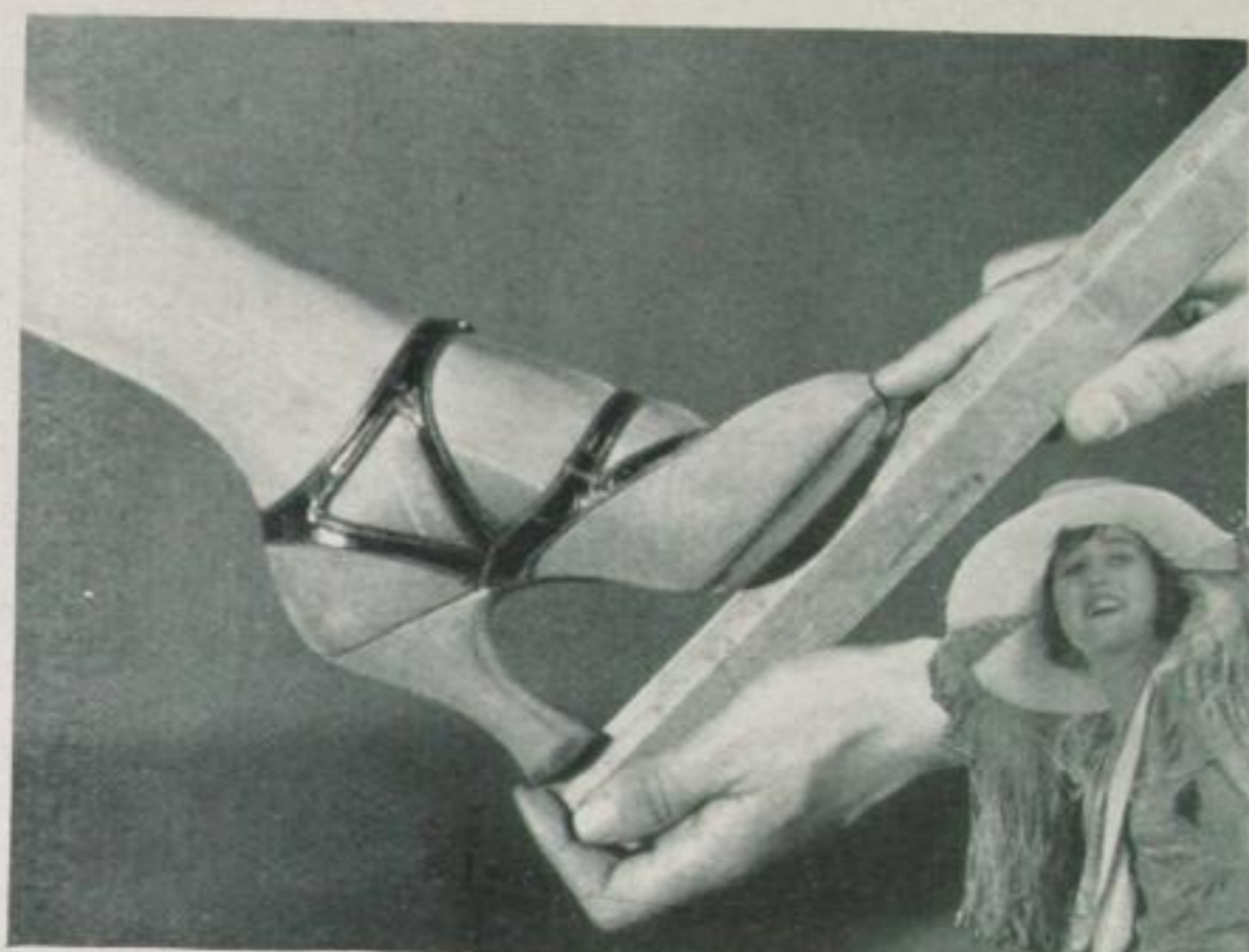
Der kleinste Schuh (7 Zoll) der Schauspielerin Gloria Swanson

ist nicht nur die vielbesungene Kleinheit des Fußes allein, sondern auch die Klugheit der Frau, ihn in die richtige Umgebung zu setzen. Würde sich sonst die entzückende Pauline Garon — nur schade, daß ihr Vorname Pauline ist — auf den Kopf eines Saurier-Skeletts setzen, um ihr Füßchen in konträrer Propor-