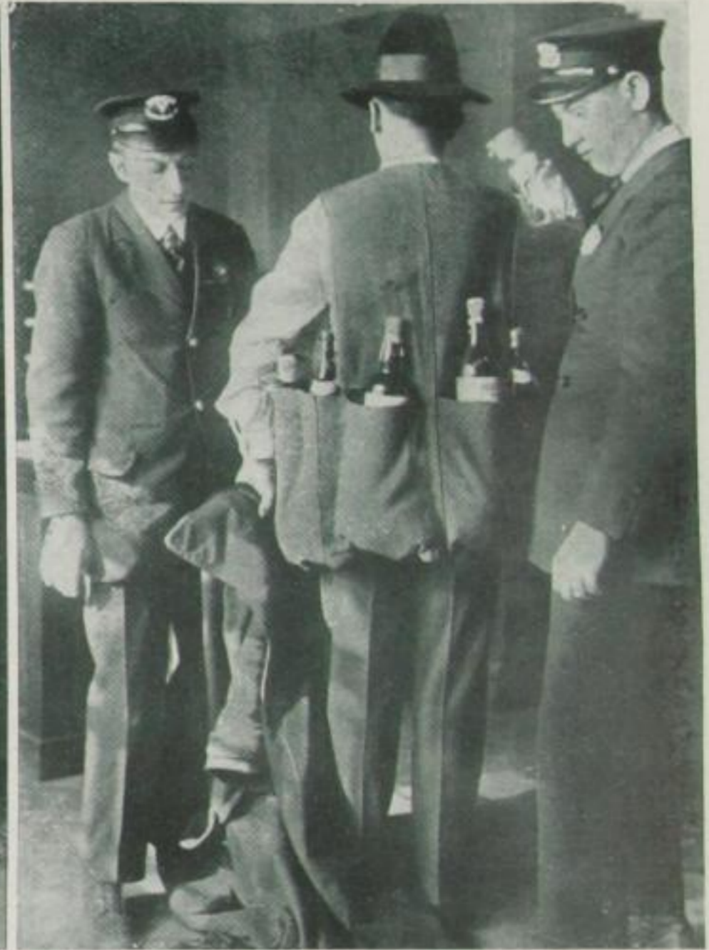
Alkoholschmuggler in Amerika