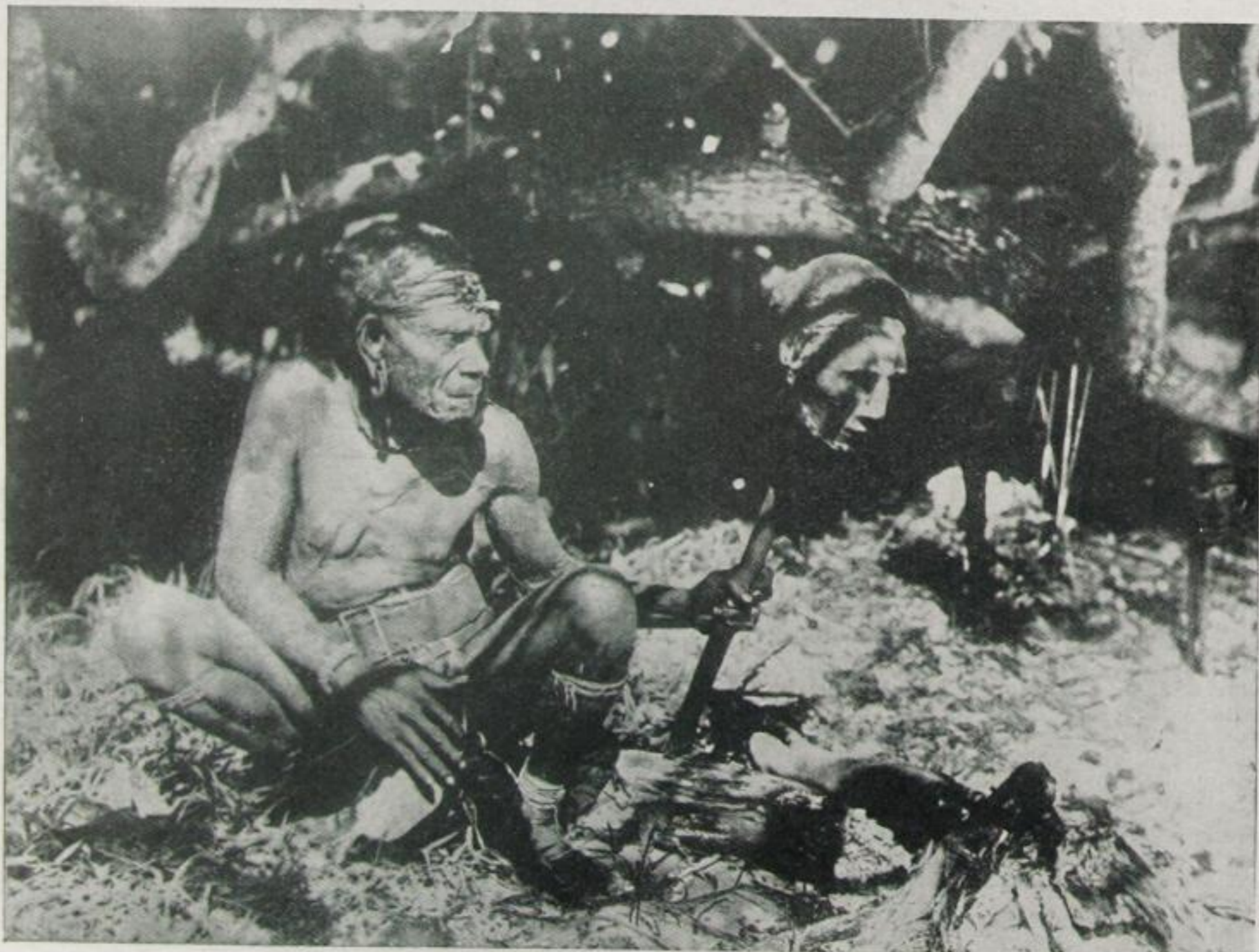
Der fertige Braten wird dem Häuptling zur Begutachtung vorgelegt