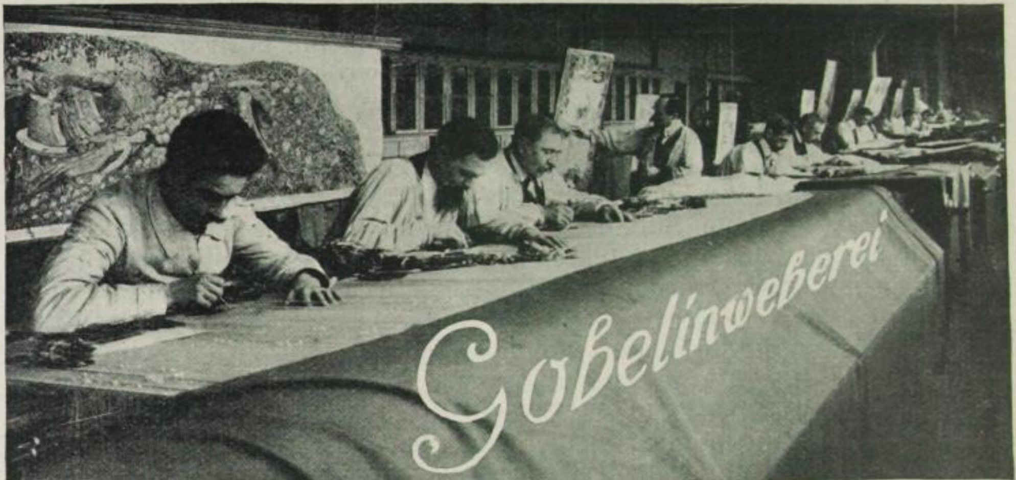
Südfranzösische Arbeiter am Webstuhl

Eine der ältesten Künste ist die des Wirkens oder Webens. — Schon zu Lebzeiten Vergils scheinen die hauptsächlichsten Methoden, die heutzutage noch in