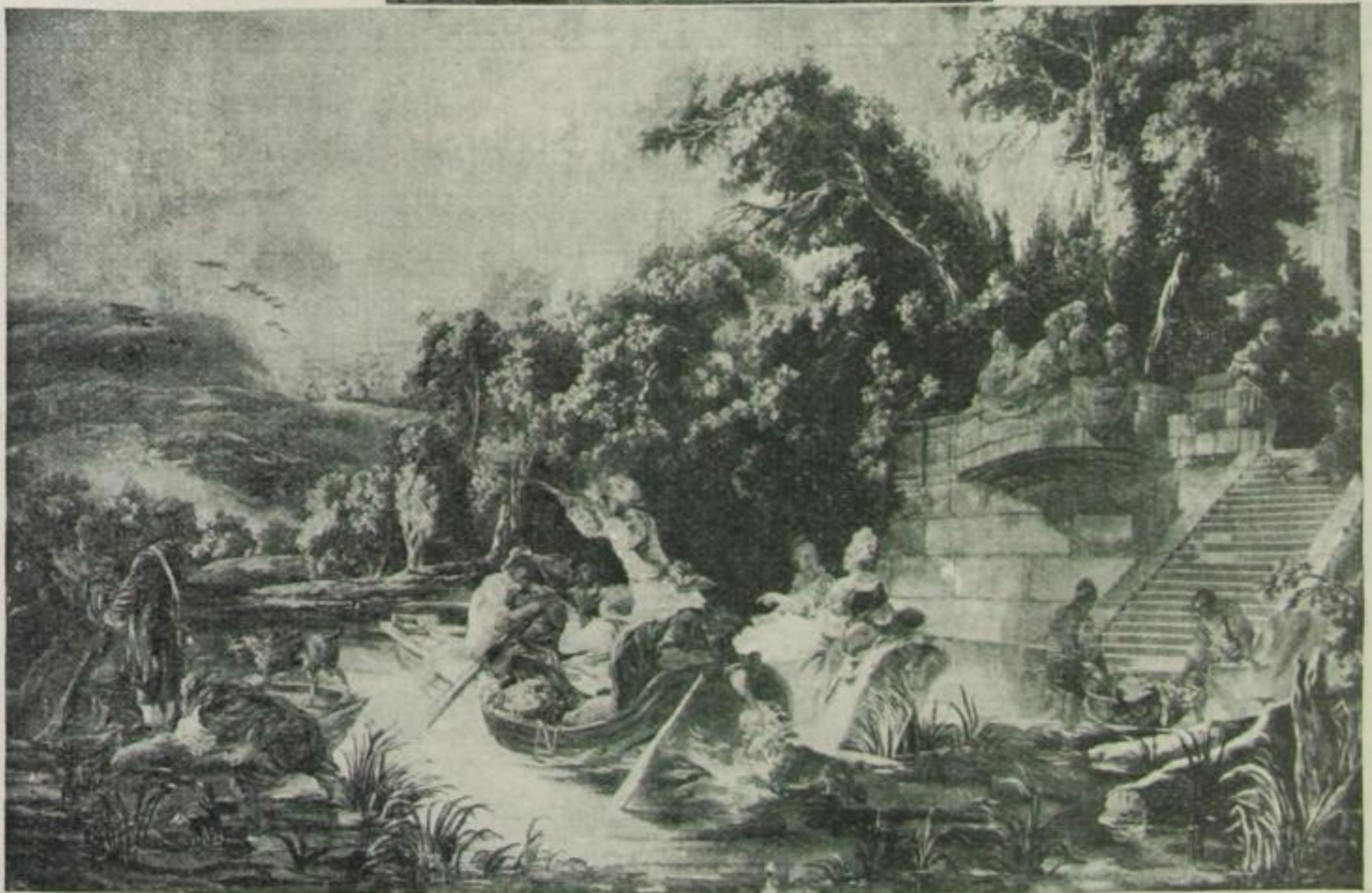
Ein wundervoller Watteau-Gobelin, eine fünfjährige Arbeit zweier Meister

der Weberei Anwendung finden, bekannt gewesen zu sein. Die berühmtesten Orte der Fabrikation waren früher Babylonien, Tyrus, Sidonien, Milet, Alexandrien, Kar-