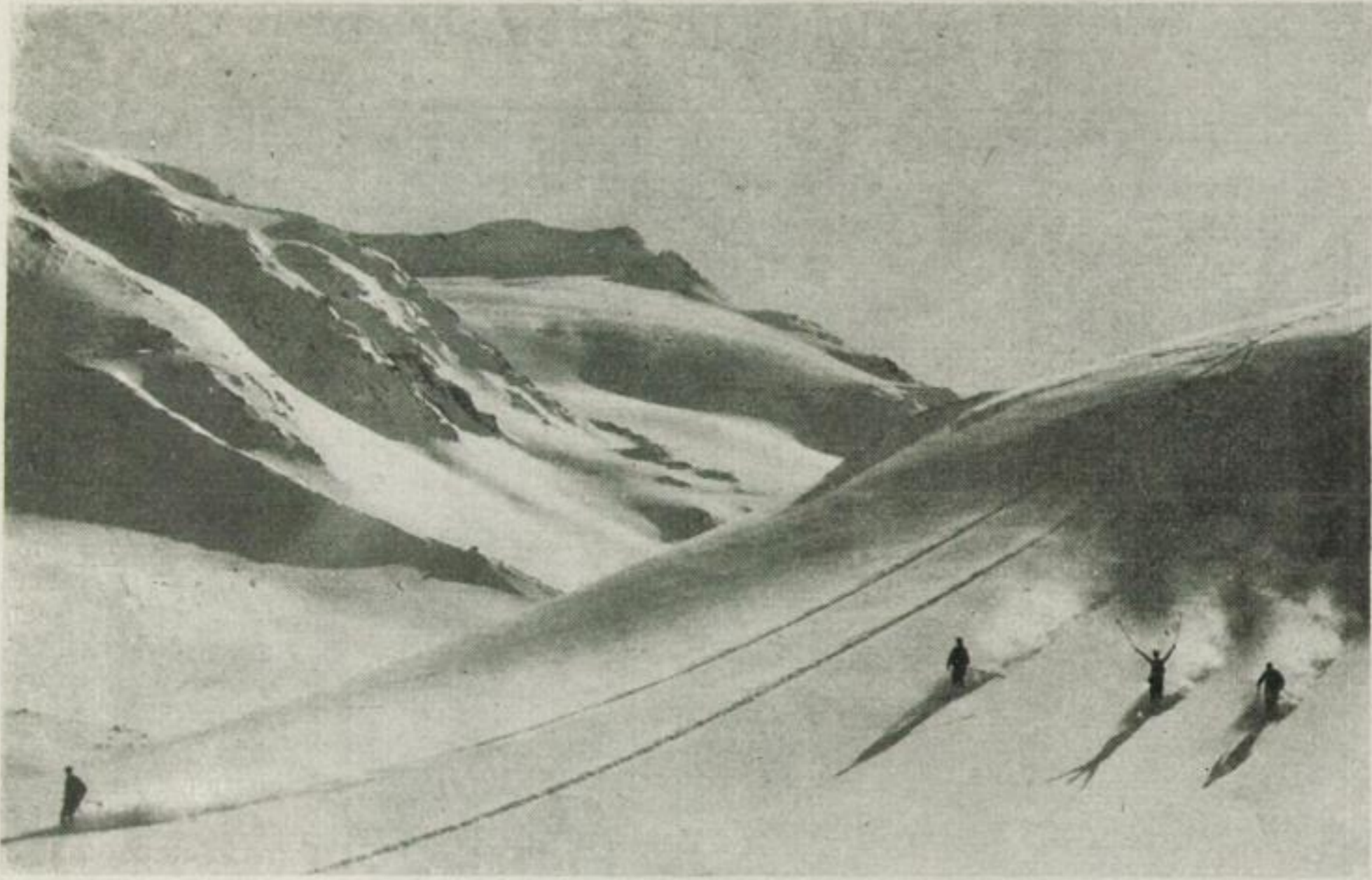
Sausende Talfahrt im Schweizer Hochgebirge