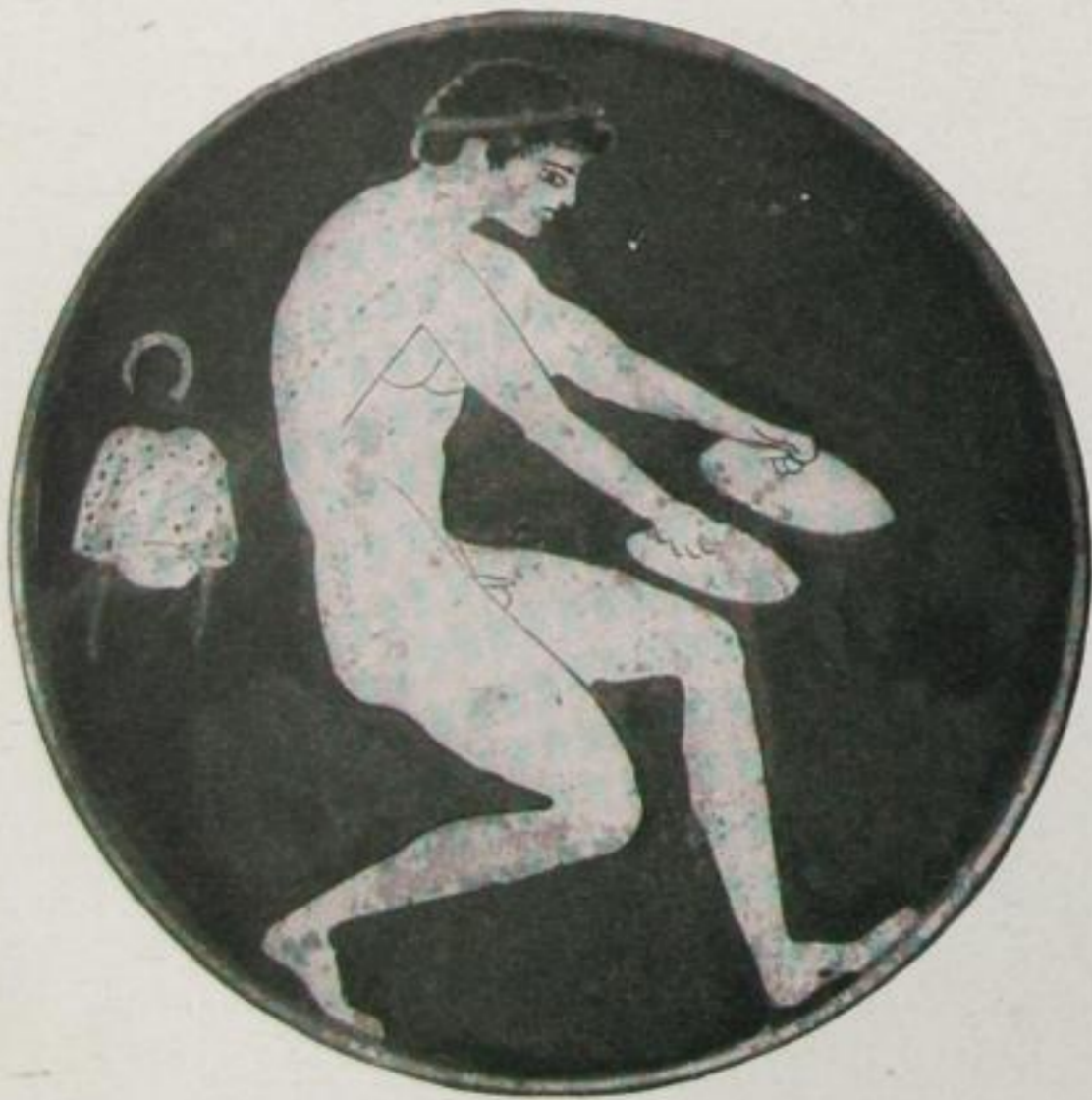
Weitspringer mit Halteren (Altes Museum, Berlin)

Eben sind die Knaben in knapp entschiedenem Lauf durchs Ziel — heiß lastet die südliche Sonne, atemlos die Spannung der Zu- schauer — alles einst selber Sieger, Mitkämpfer, mit Kampf- fieber — da ringt sich der stählerne Schrei befreit aus der Brust, erstarrt ist die Menge der Zuschauer, verwirrt: dieser ein- zelle! — sonst tobte die Menge gemeinsam; — schon mengt sich zum Entsetzen die Neugier — der Beifall setzt aus — : man sieht eine Gestalt von der untersten Reihe der Sitze sich lösen, in stürzendem Lauf in die Kampfbahn stürmen — die Spannung löst sich: die