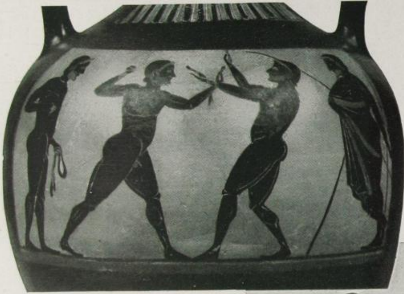
Faustkampf zweier Epheben mit Faustriemen Bild von einer panathenäischen Preisamphora