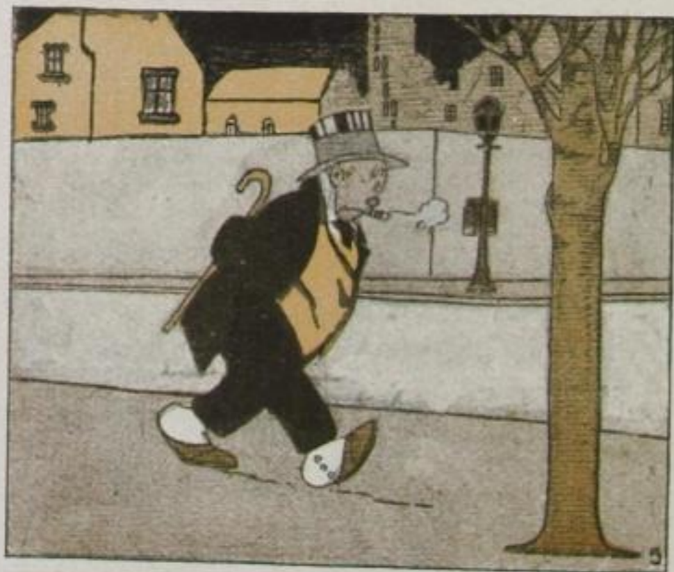
Schwer verstimmt zieht er von hinnen, Tiefbekümmert sieht man ihn Ueber all' die Mängel sinnen, Die im Weltsysteme drin