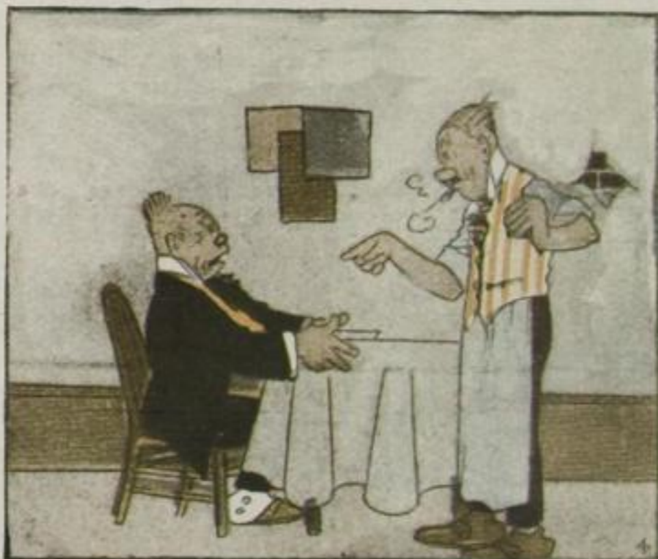
Knolle möchte gern was essen, Doch der Wirt lehnt dieses ab: „Haben Sie denn ganz vergessen, Daß ich keine Küche hab?“