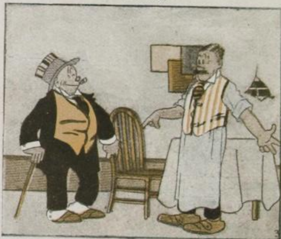
So betritt - erhobnen Hauptes - Er sein altes Stammlokal. „Knolle!“ ruft der Wirt, „wer glaubt es, Sieht man Sie auch wieder mal?“