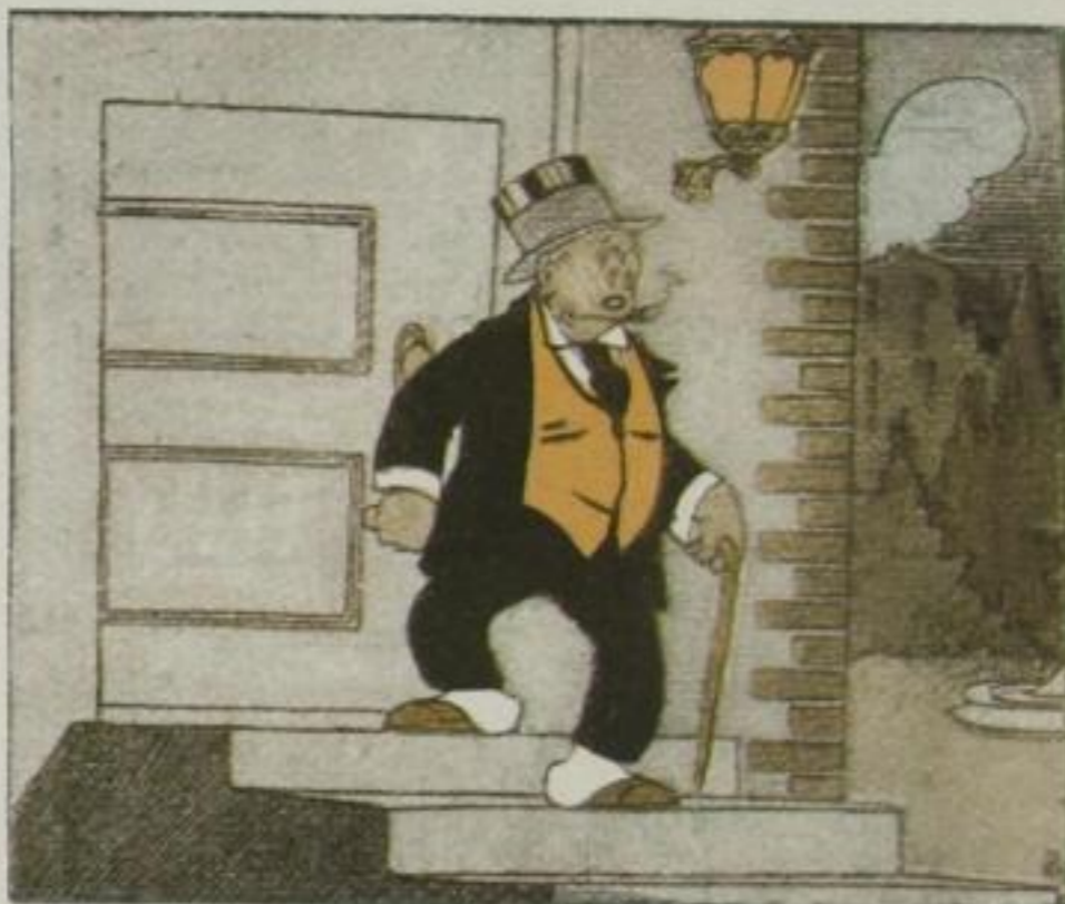
Knolle in Person sieht steuern Man vergnüglich in die Stadt, Weil er auswärts möchte feiern, Was vielleicht was für sich hat.