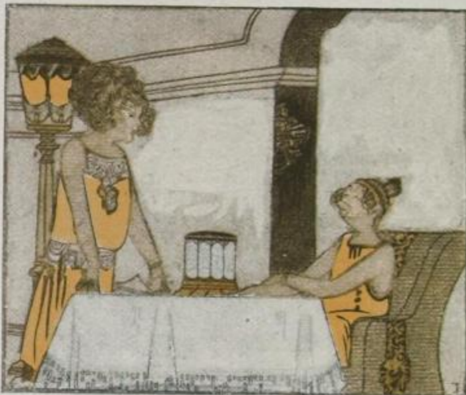
Frau und Fräulein Knolle denken Intensiv darüber nach: Was man Knolle könnte schenken, Welcher heute Namenstag.