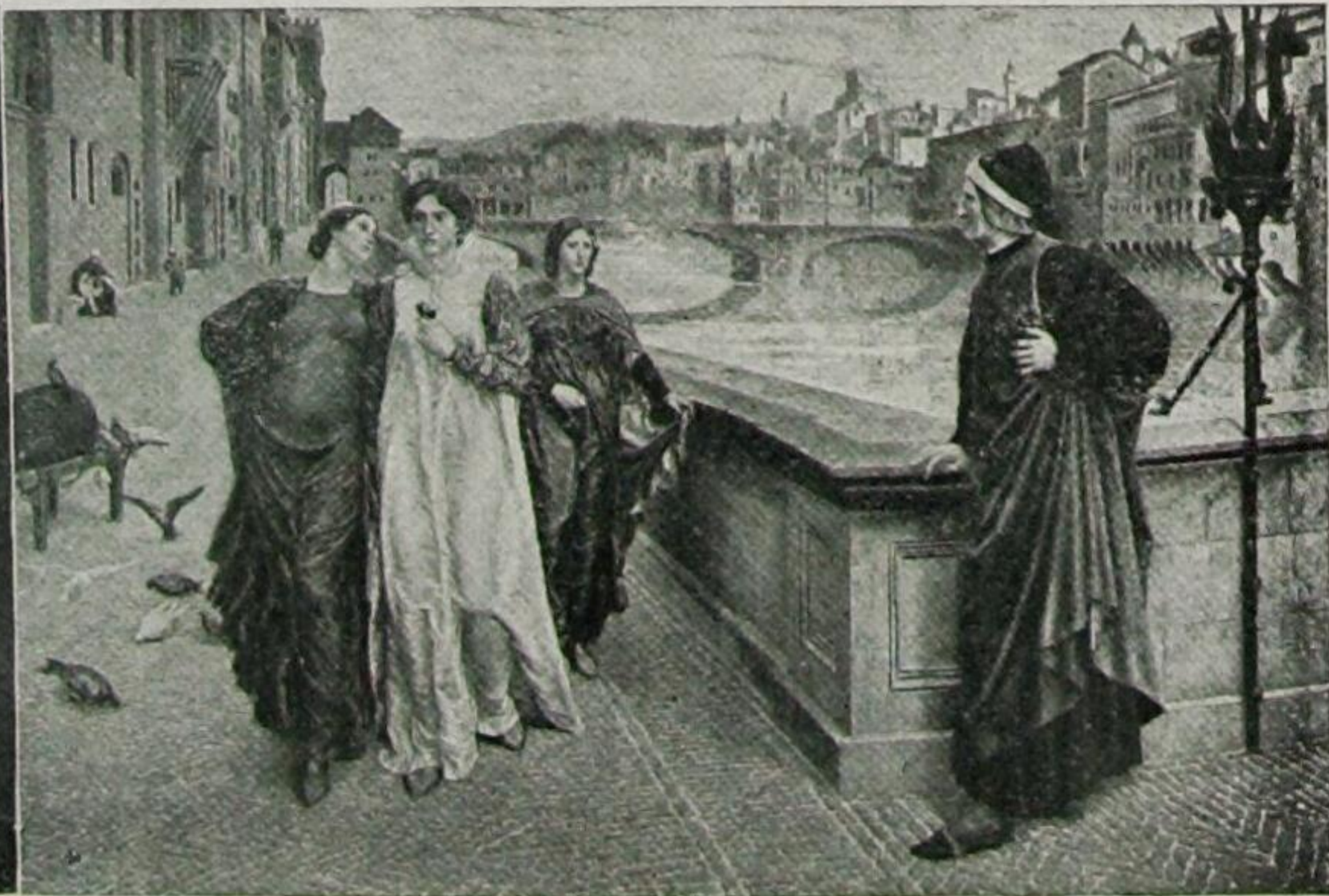
Dante und Beatrice