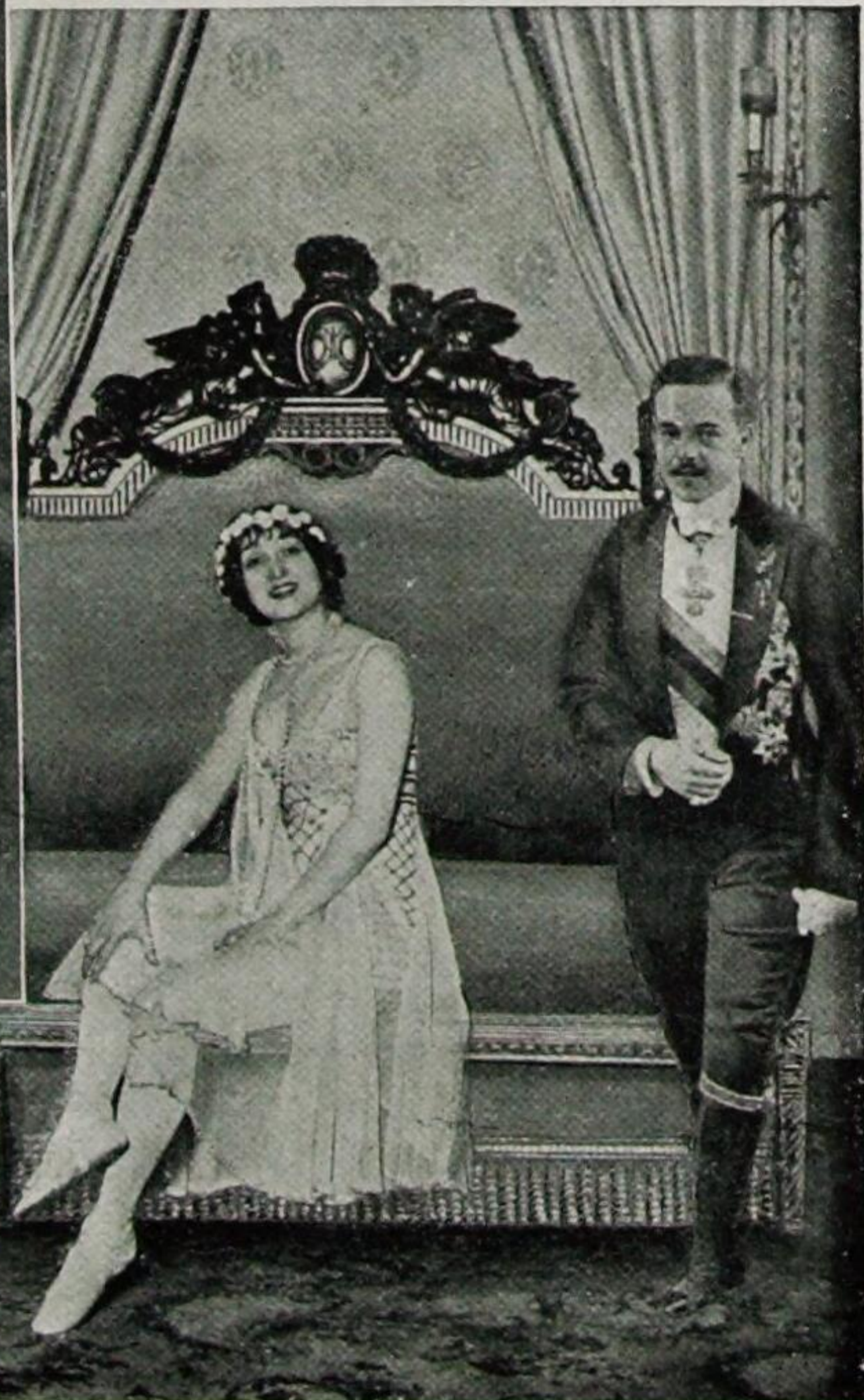
Der Exkönig Manuel von Portugal und die Tänzerin Gaby Deslys

in ihre Garderobe. Es war Manuel, der zwanzigjährige portugiesische König. Und bald wurde sie — wie sie sagte — „die kleine Freundin des grossen Königs“, die er mit Verzicht auf seinen Thron heiraten wollte.