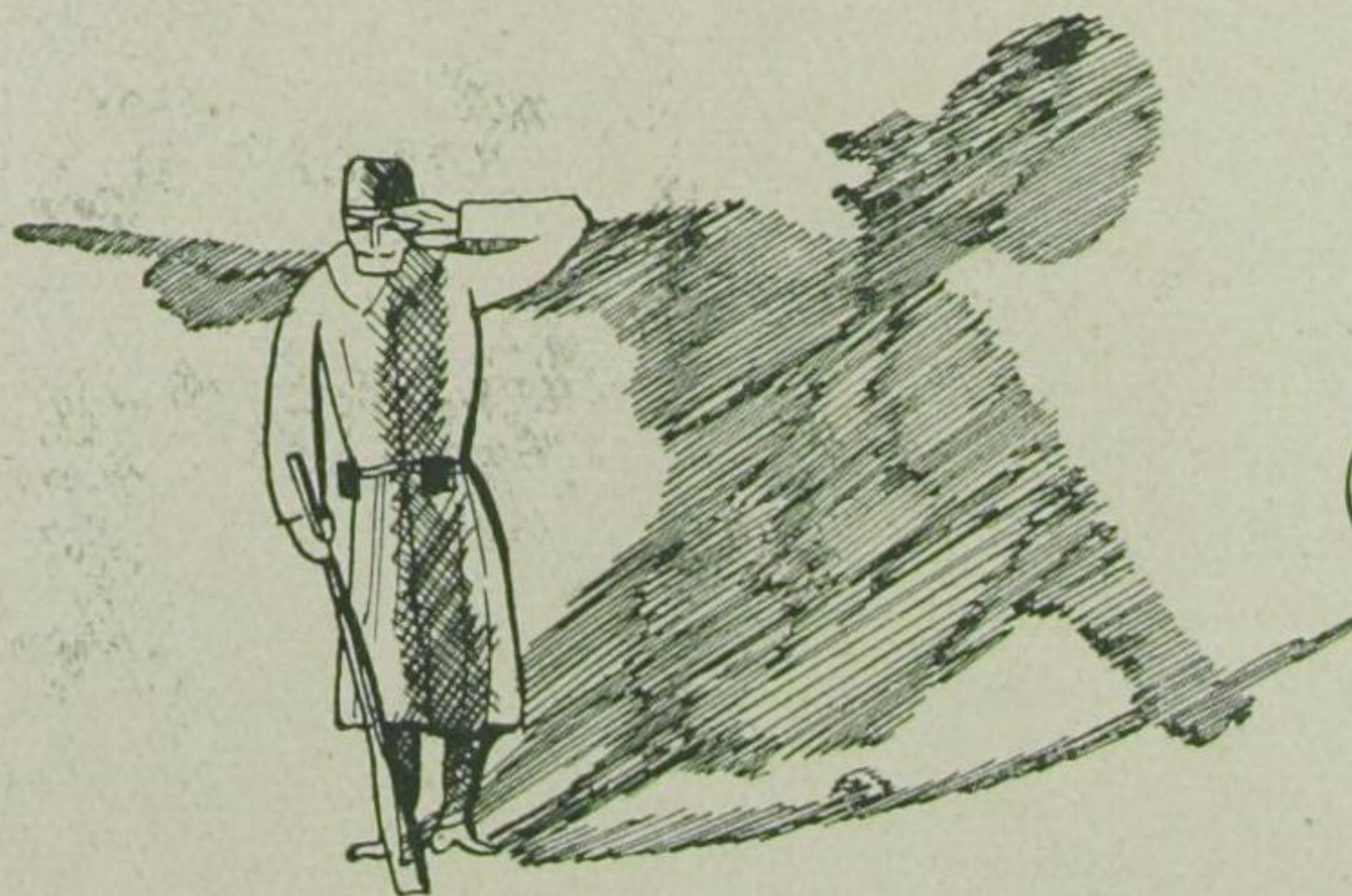
Der Mai war kühl, oft noch im Brisa, für spüt schon in der Wotkrisa.