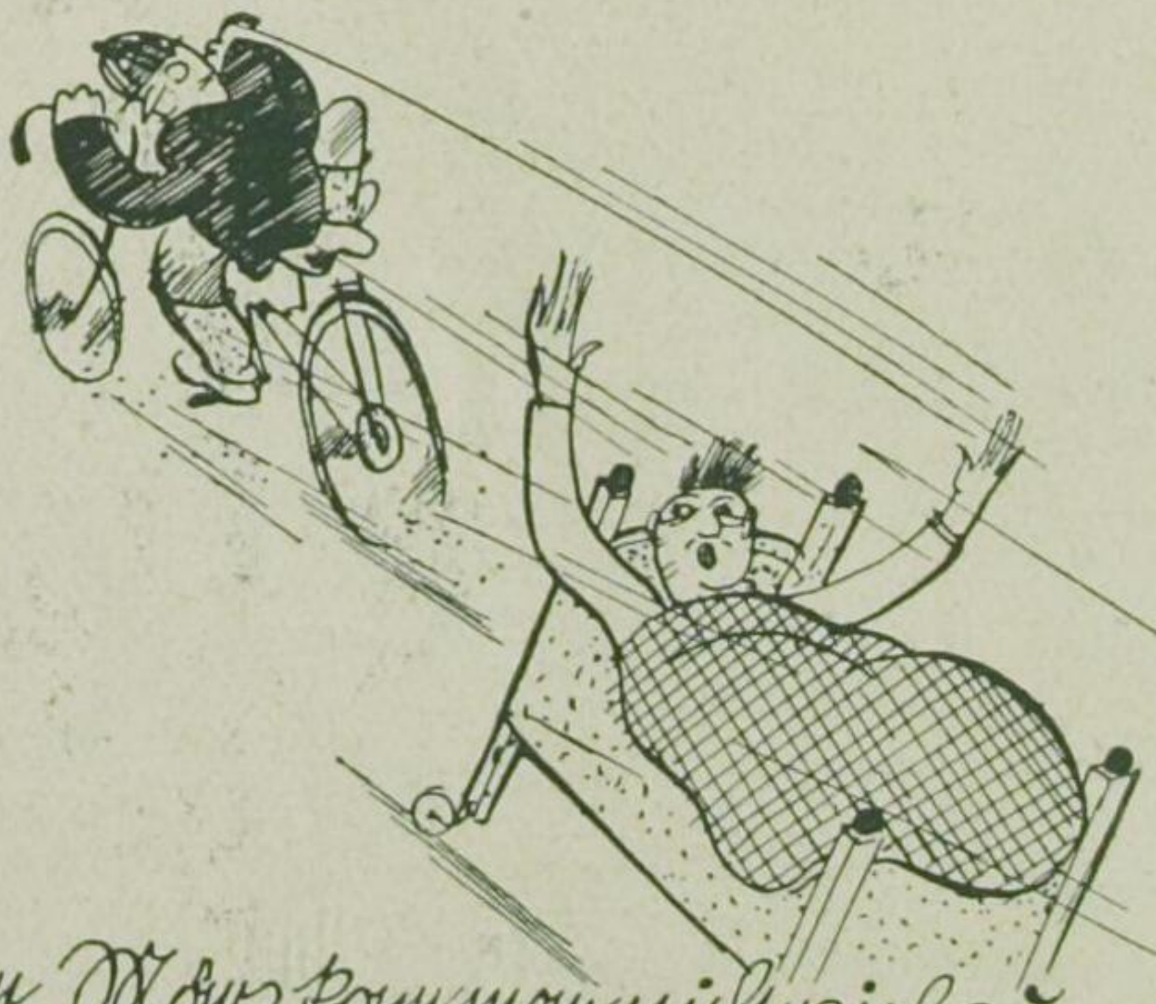
Im März Kommunisten sind zum Vornun, das lag noch am Tag der Vornun.