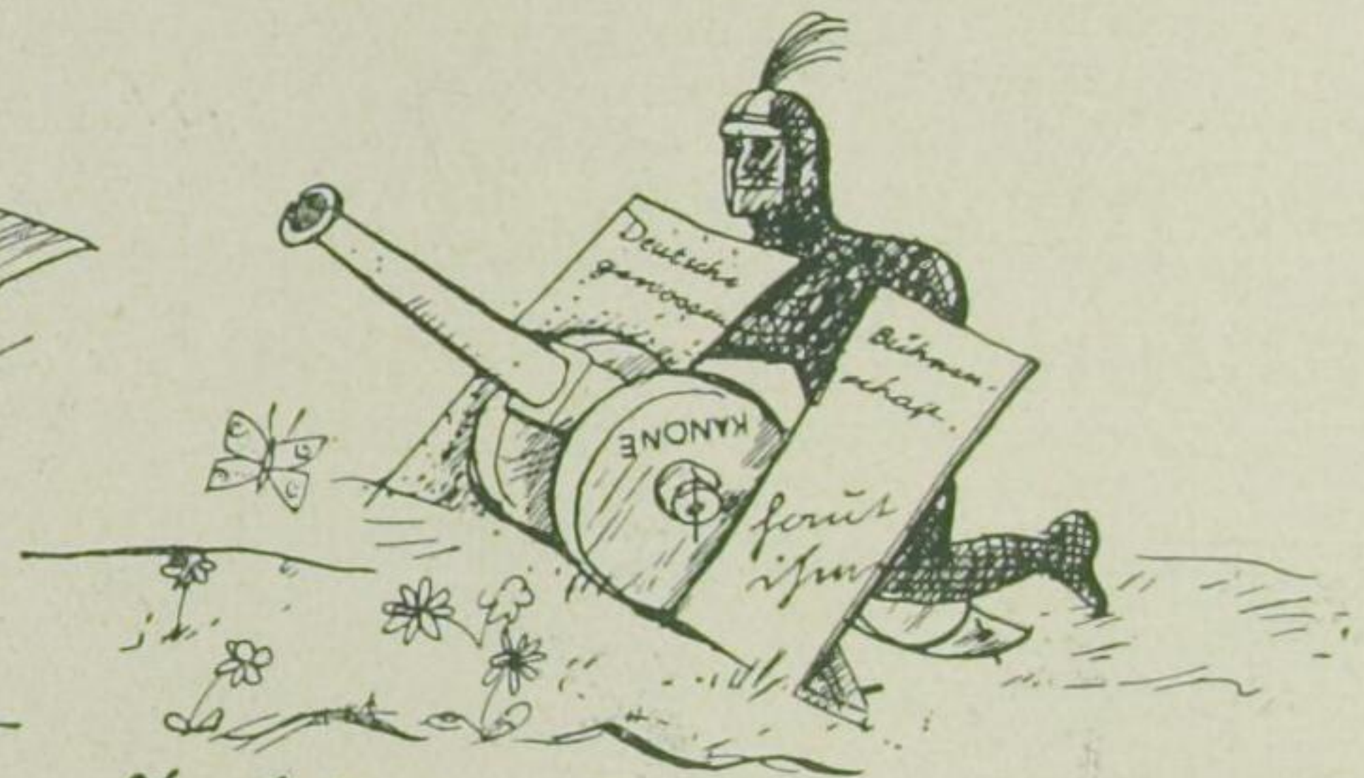
Im Februar Dämpf Rumpel pflo gegen ein Jagu-Demonstrion.