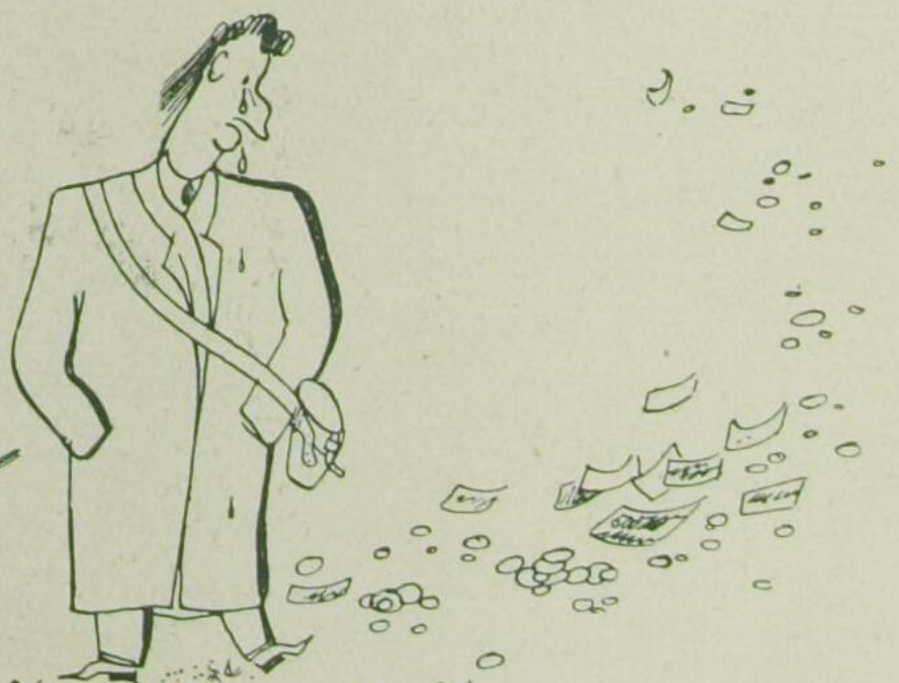
Im Juni: Auf dem Horn der Moor bim Dabigis sind Goldbarlor.