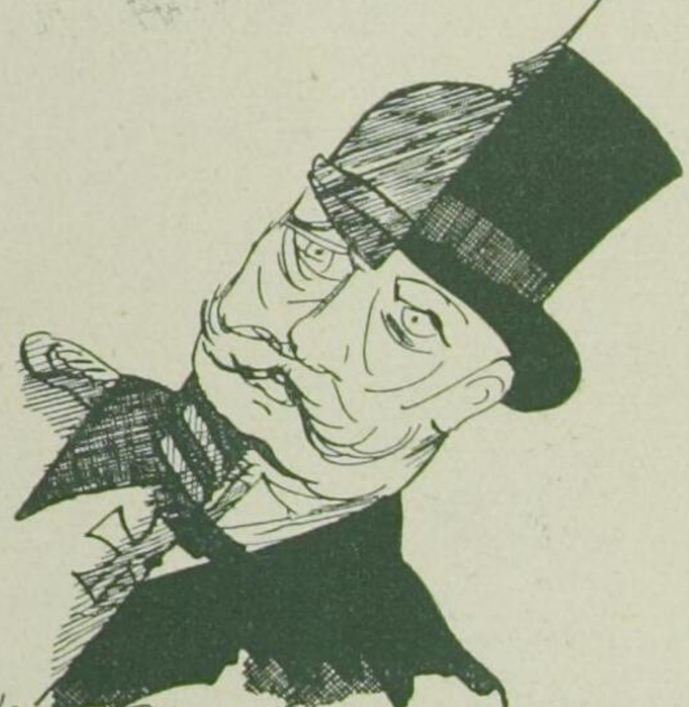
Und im April - das jeder Kunst- ward Zindubing und Reisprophet.