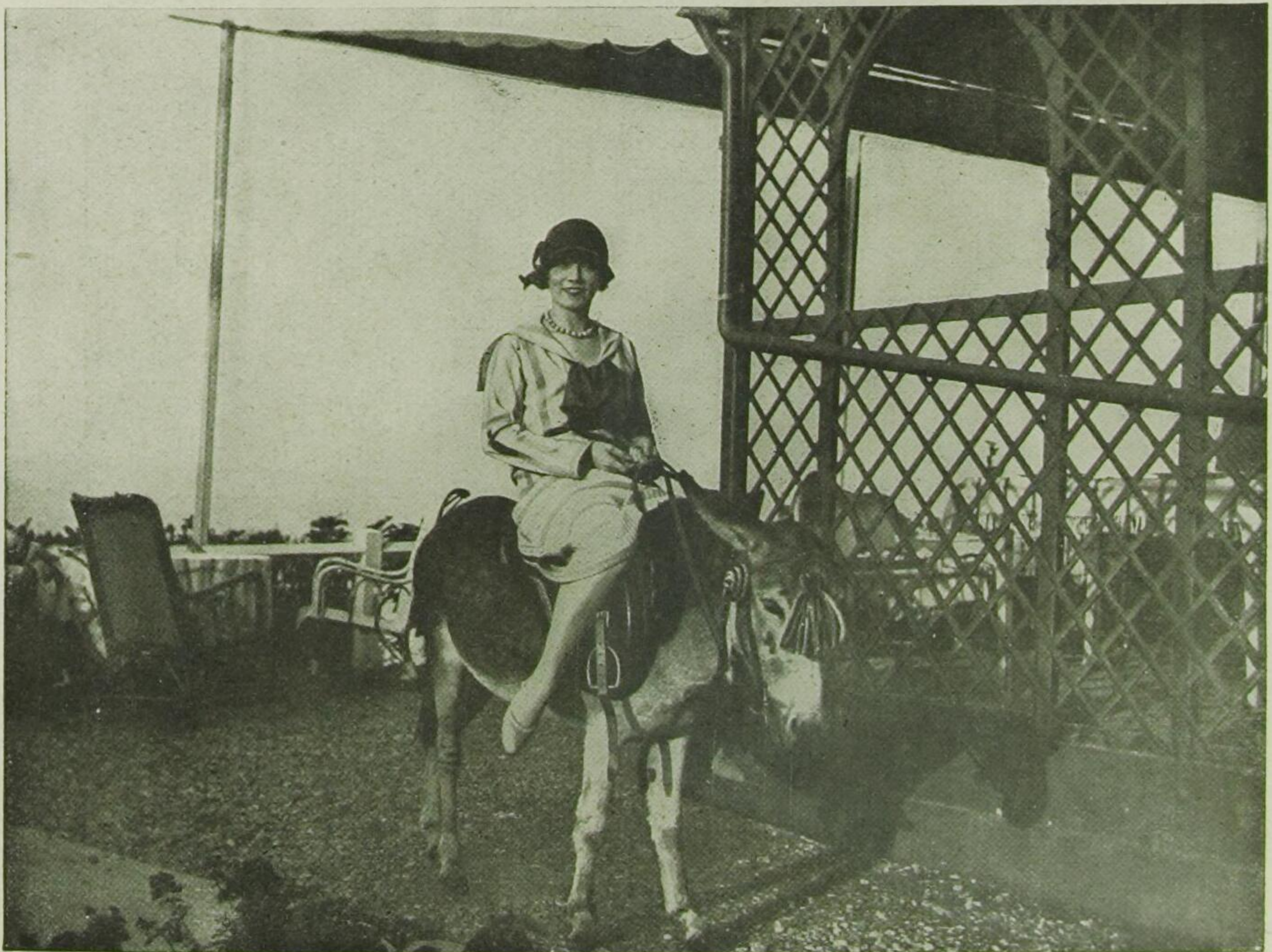
Die Siegerin im Eselreiten in Monte Carlo