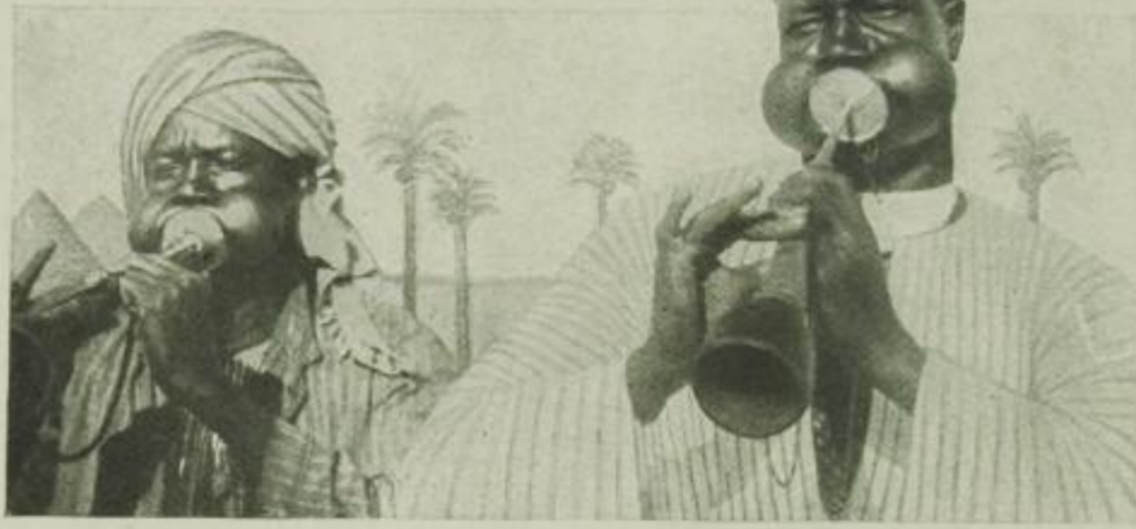
Die Wüstenjazzband Sudanesische Eingeborene blasen Flöten, die ähnlich wie Dudelsackpfeifen klingen