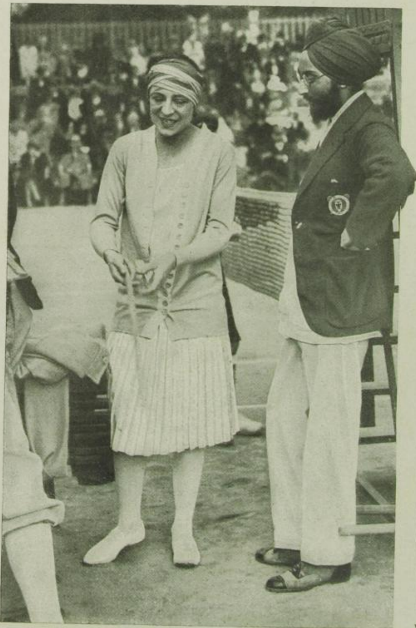
Die beiden einzigen Turbanträger bei dem grossen Tenniswettpiel in Cannes: Suzanne Lenglen und der Radjah von Johore