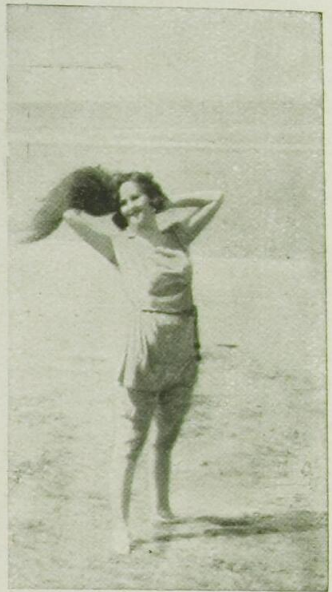
Eine seltene Erscheinung: Die Dame ohne Bublikopf

Deauville ist der Ort der Frauen. Schöner, reizvoller Frauen, uniformierter prachtvoller Erscheinungen. Das zieht über die meerumspülte Steinpromenade — weiss, weiss und wieder weiss.