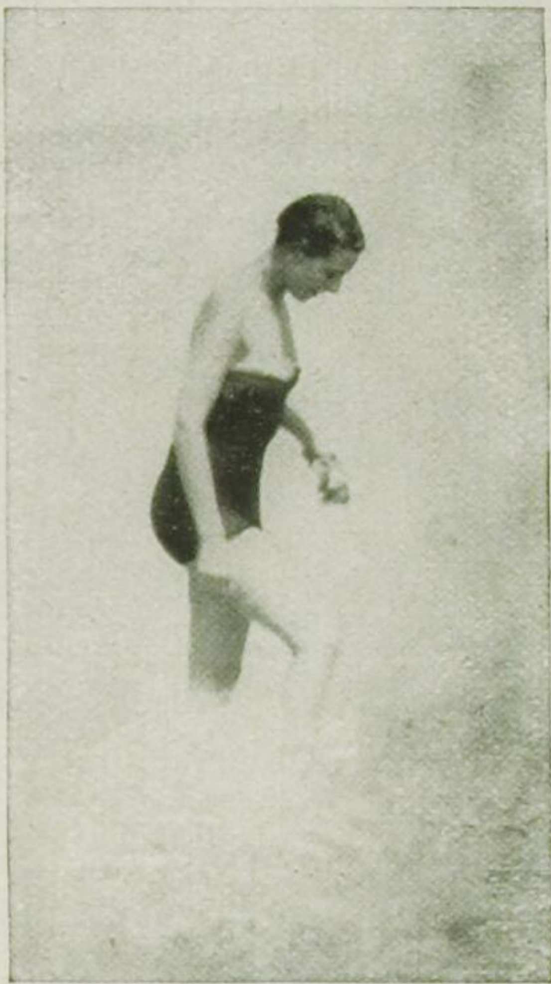
Die Tänzerin Ida Rubinstein

Ab und zu unterbrochen durch grellbunte Flecken, siegellackrot, zitronengelb, hauptsächlich prachtvolle Kontraste zu dem blauen Meer. In hohen schmalen hochhackigen weissen Schuhen oder in bequemen, fast absatzlosen amerikanischen Latschen.