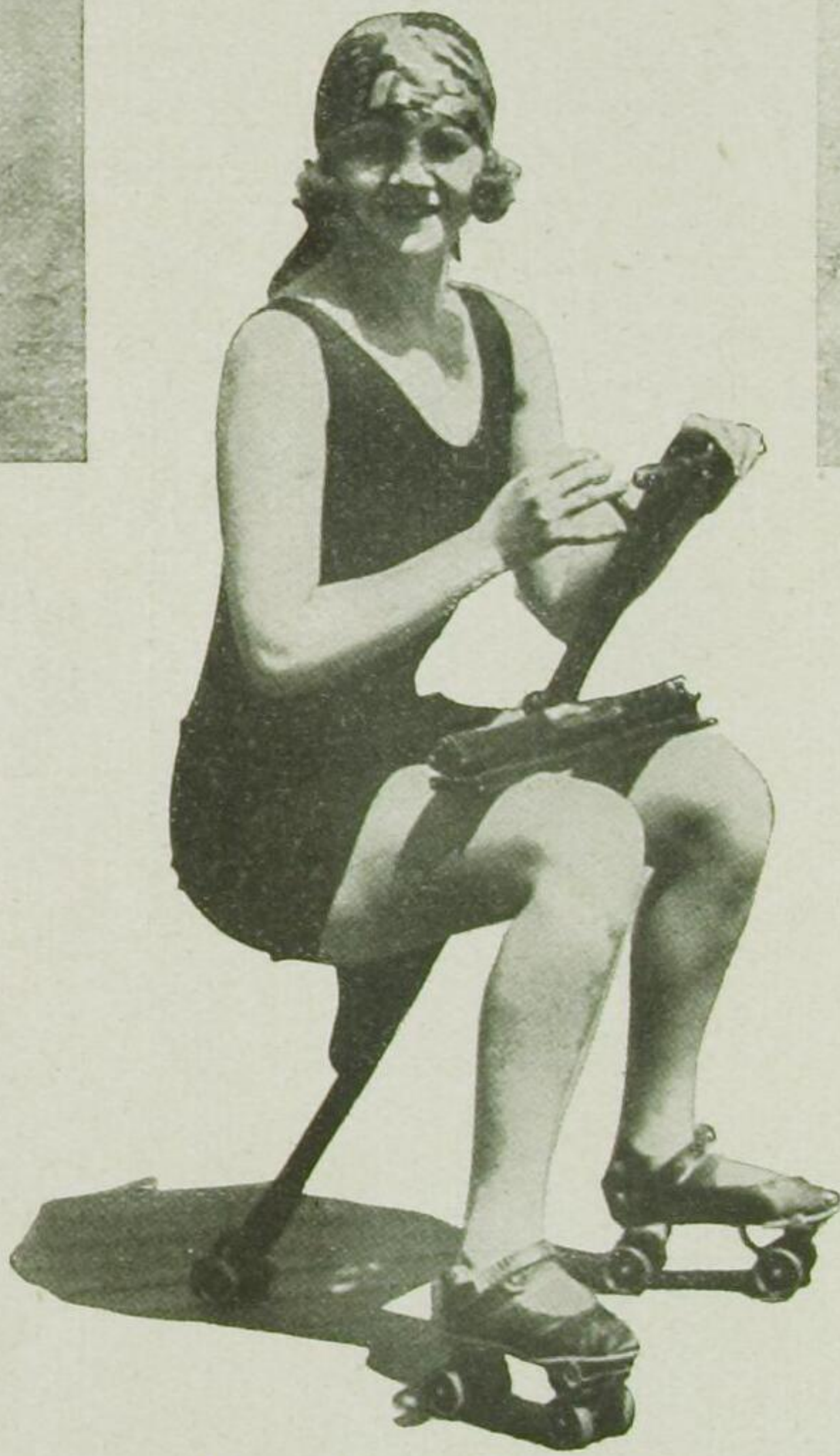
Hoppe, hoppe Reiter . . .

Bunte Schals umrahmen ockergelb geschminkte oder reell gebräunte Gesichter mit karmoisinroten Lippen, tief-schwarz gestärkten Wimpern, fein getuschten japanischen Augenbrauen, grossen glänzenden Augen über feinen kleinen witternden, gepuderten Näschen.