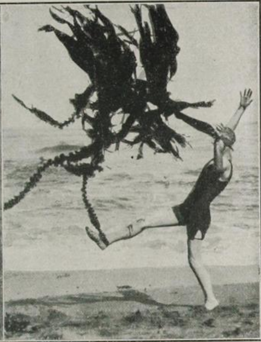
Eine Badende amüsiert sich tanzend mit einer Seealge, wobei ihr der Wind zu Hilfe kommt