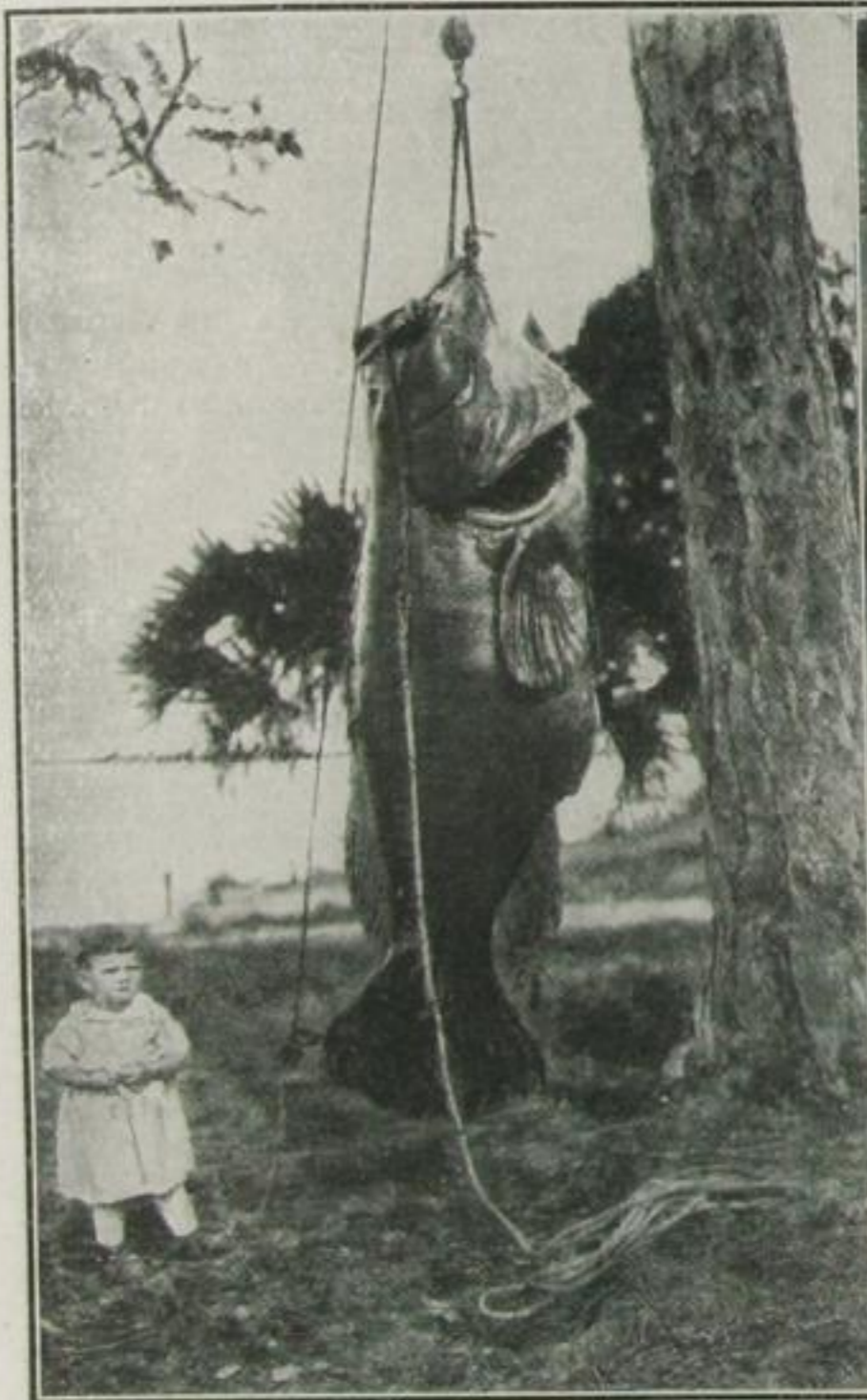
David und Goliath Ein Riesenlachs, in Kanada gefangen