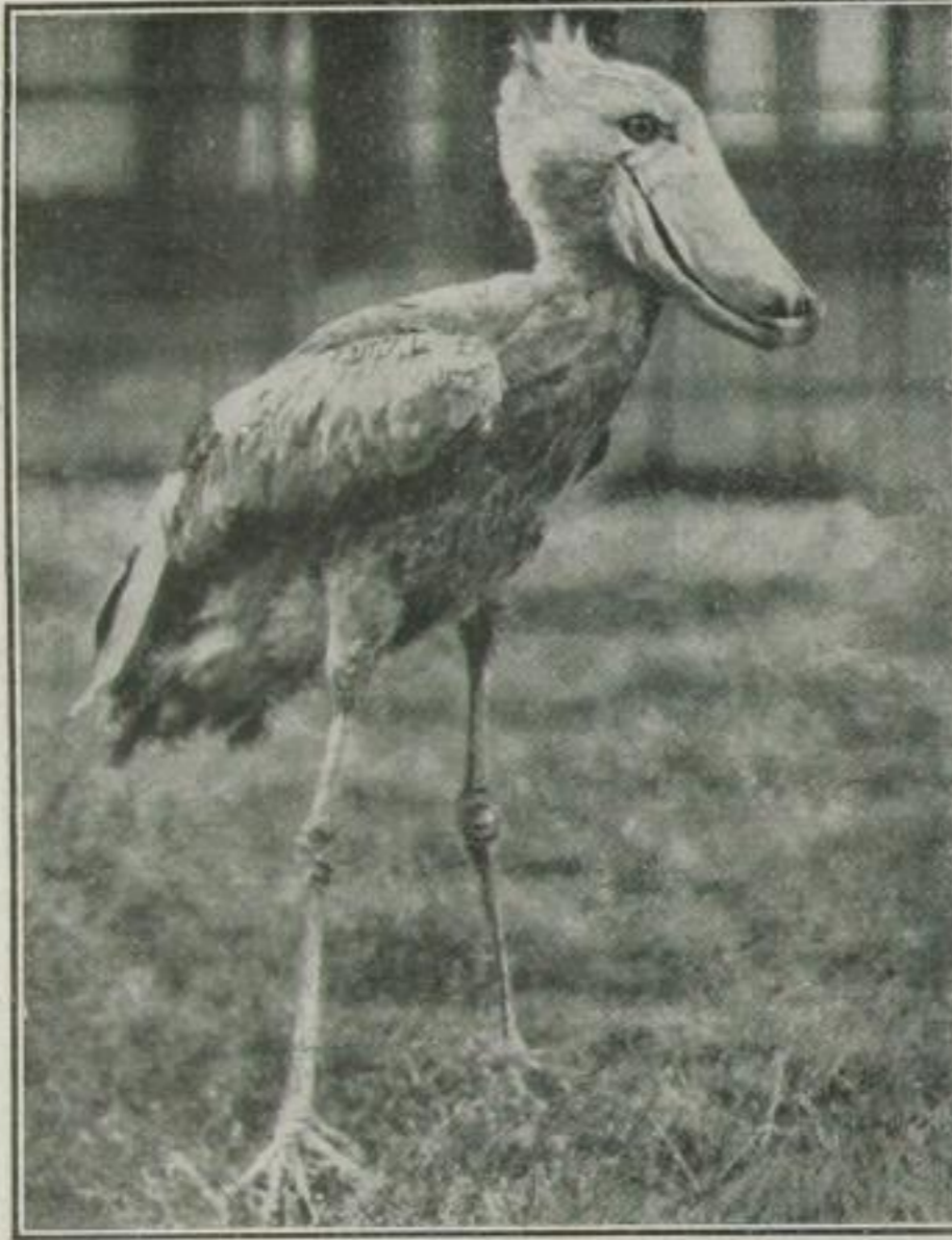
Der Schuhschnabelstorch, der selbst in seiner Heimat am Weissen Nil selten geworden ist